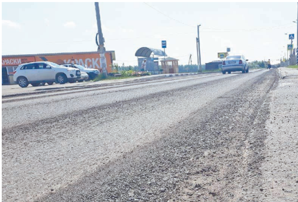
Ремонт дороги Лапшинка - Кабицыно.