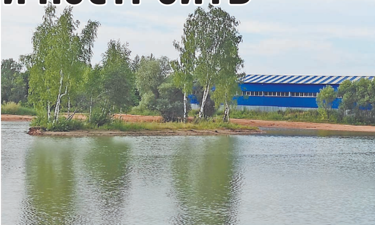
Пруды в Балабанове.

Безусловно, это не аттракцион неслыханной щедрости, а ответ на большую проделанную работу. Корни этой весьма значимой для района истории уходят в 2018 год, когда состоялись выборы столичного градоначальника.