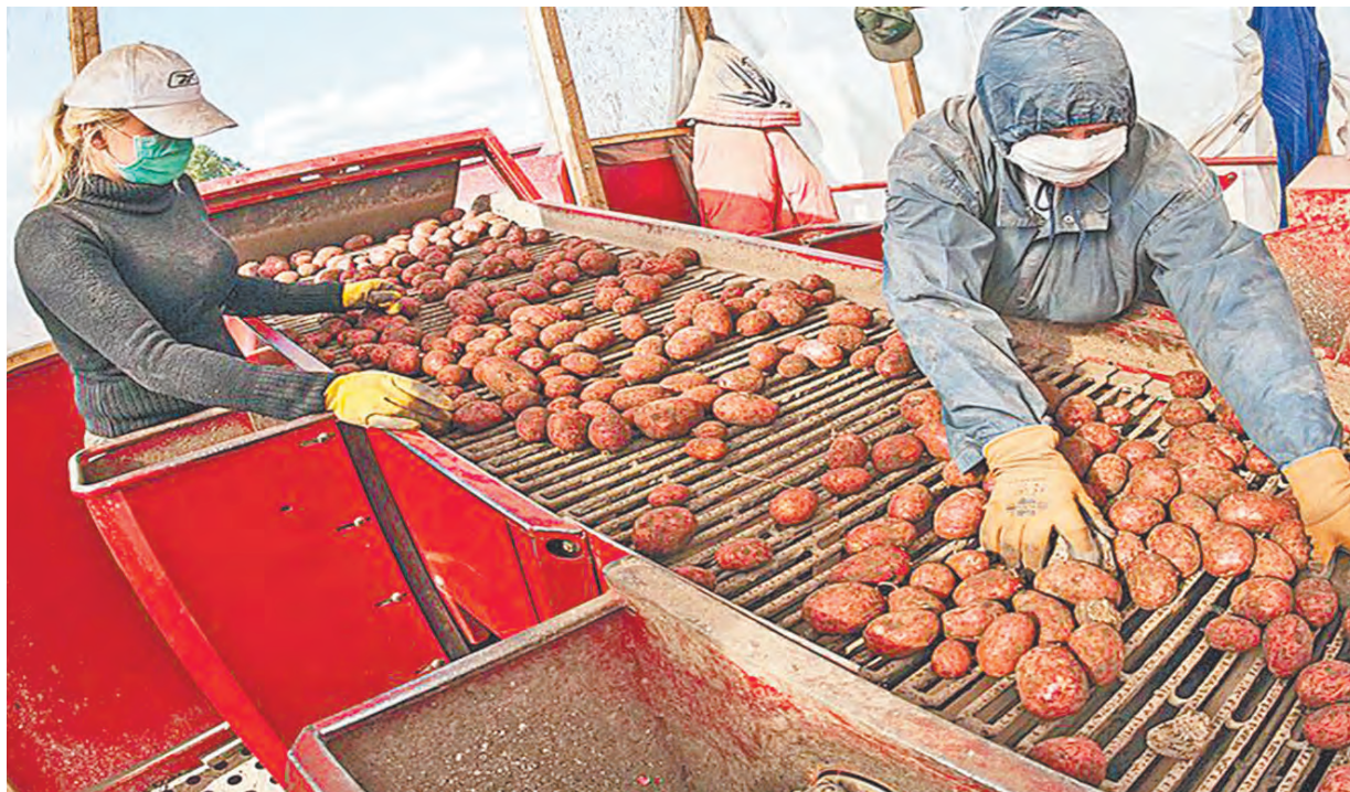
Уборка картофеля в Бабынинском районе.

Погода в этом году была на редкость капризной, не баловала аграриев. Поэтому и сроки уборки урожая затянулись, как никогда.