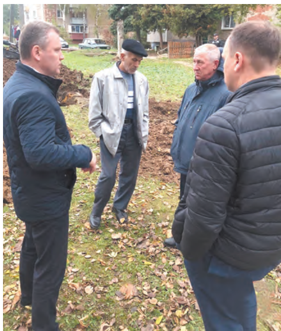
Оперативное совещание на месте очередной аварии.