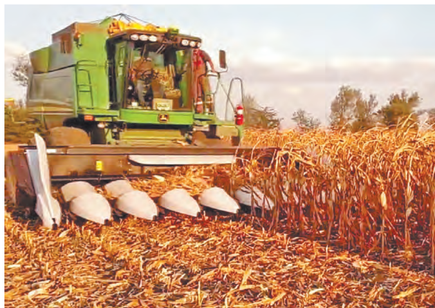
Уборка кукурузы в Перемышльском районе.

ные культуры посажены на общей площади более 400 гектаров, убрано 60 % от запланированных площадей. На сроки сбора овощей также повлияли неблагоприятные погодные условия.