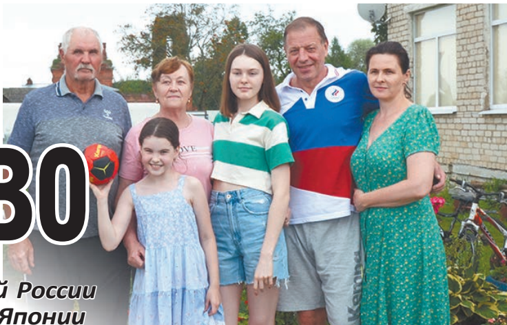
В кругу семьи.

Главный тренер женской сборной России по гандболу после Олимпиады в Японии приехал в деревню Юхновского района