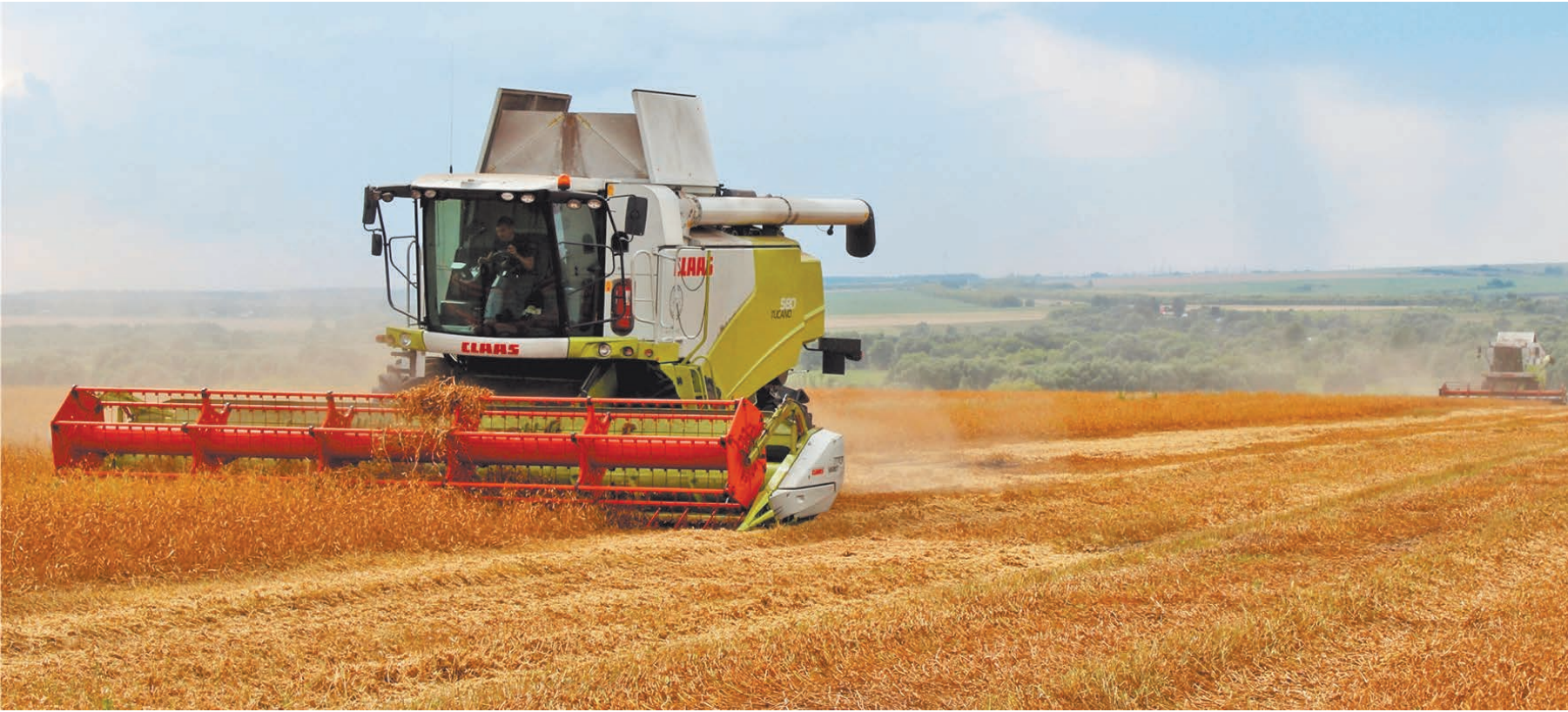
Уборка пшеницы в ООО Агро-фирма «Мещовская».