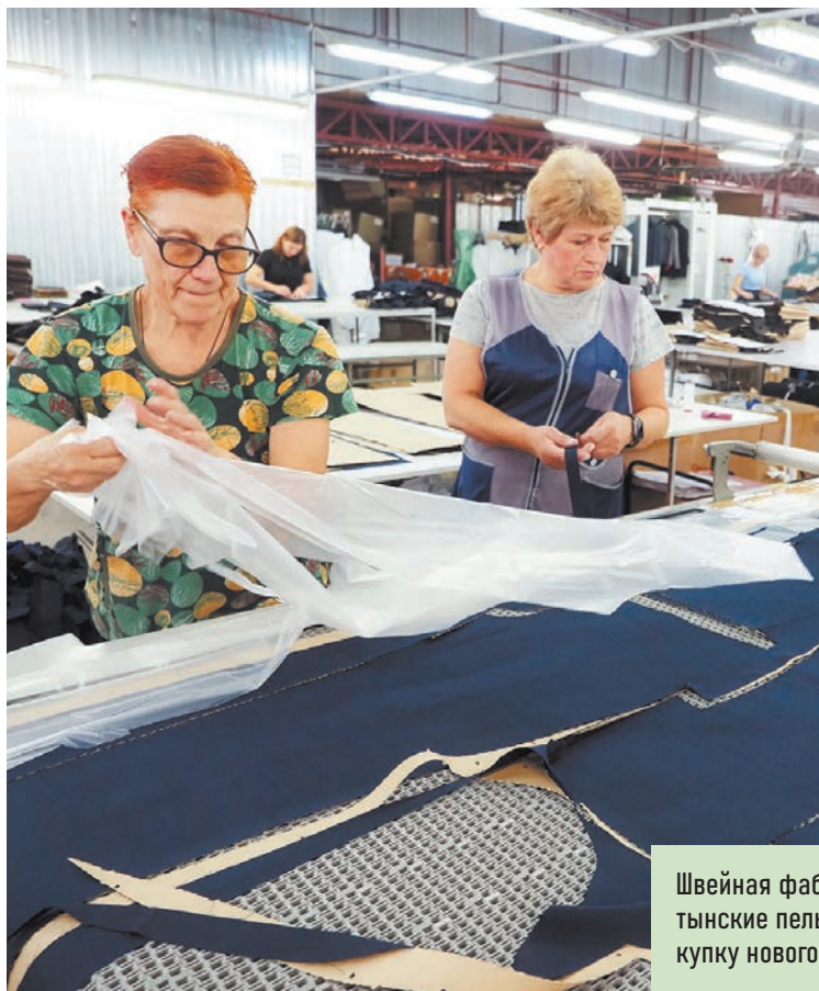
Швейная фабрика «Дибони» в поселке Середеевском Сухиничского района и ООО «Воротынские пельмени» из Бабынинского района регулярно получают господдержку на закупку нового оборудования, на выставочную деятельность.

В нашем регионе сохраняется положительная динамика по количеству МСП в приоритетных отраслях, ориентированных на внутренний спрос: ИТ, общепит и гостиничный бизнес, наука, обрабатывающие производства.