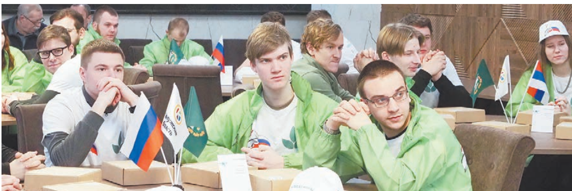
На открытии чемпионата.

В ходе недавнего визита в нашу область гости из Гомельской области Республики Беларусь посетили Калужскую машинно-технологическую станцию, обсудили ее предстоящее техническое оснащение агродронами. Наших специалистов заинтересовал белорусский опыт эффективного использования БПЛА, широко применяемый в сельском хозяйстве братской республики. Прямое профессиональное общение станет основой для укрепления нашего общего аграрного рынка.