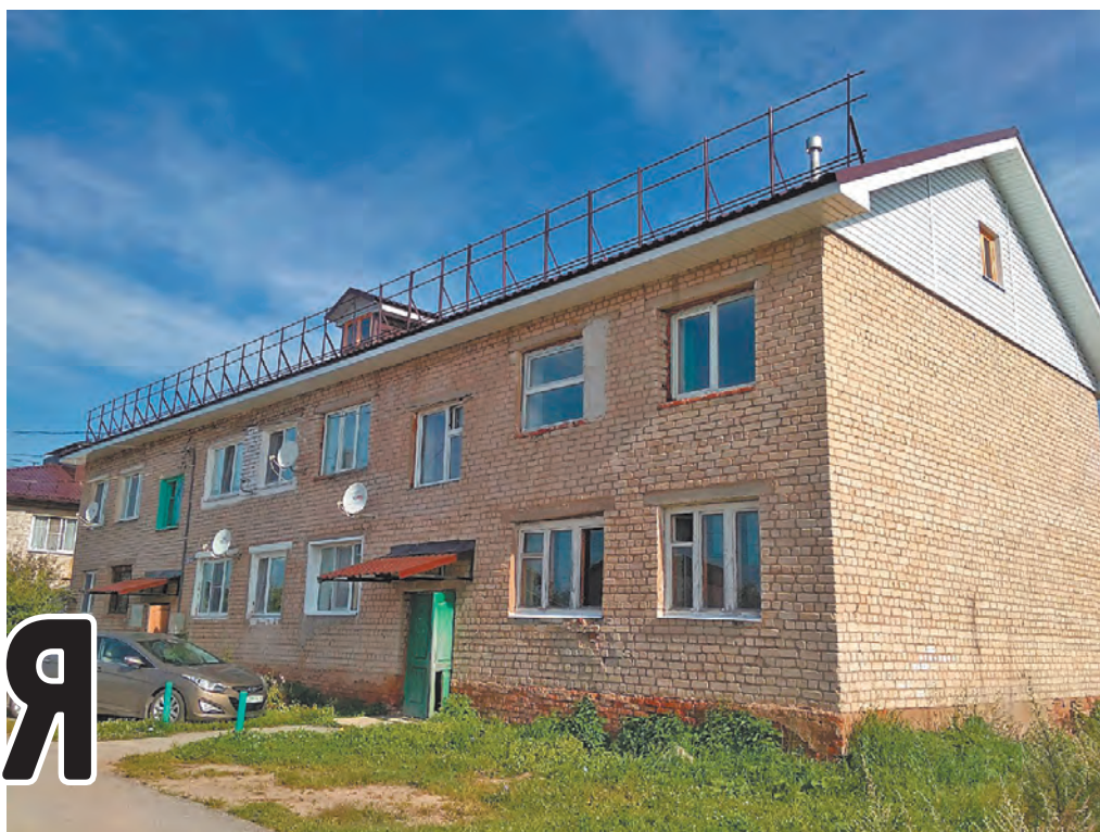
В доме № 3 на улице Мичурина по программе капремонта обновили крышу.

В нынешнем году в селе привели в порядок протекающие крыши двух домов. Эти постройки старые и давно требовали к себе серьезного внимания. Затраты финансировал Фонд капремонта области, куда квартировладельцы ежемесячно отчисляют взносы. Стоимость работ составила порядка трех с половиной миллионов рублей.