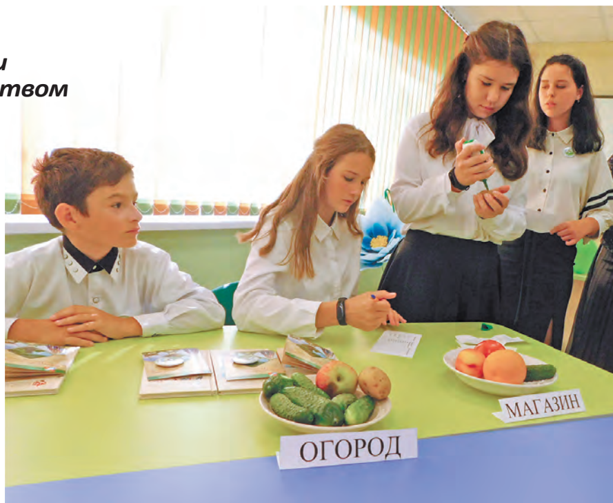
Ребята исследуют овощи на наличие нитратов.

Такое направление профориентационной работы основано на том, что в Дзержинском районе работа в агропроме становится все более престижной. На формирование такой тенденции оказывает свое влияние появление современных предприятий, где ставка делается на интенсификацию производства и использование новых технологий. И средняя зарплата в сельском хозяйстве сейчас повыше, чем во многих других промышленных отраслях района.