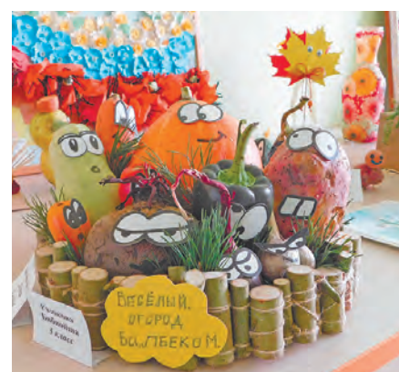
Школьная выставка урожая.

шины, механизмы. Я уверена, что занятия в этом классе помогут вам с выбором профессии.