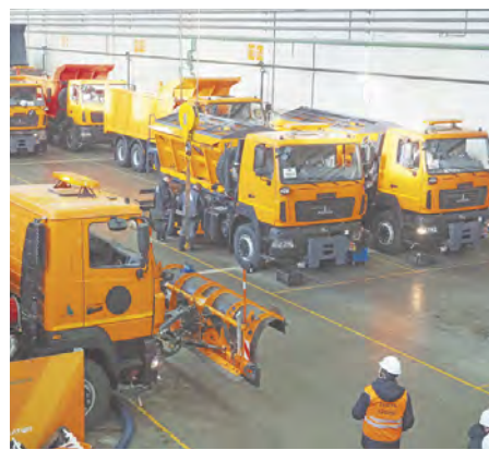
Гостей впечатлила экскурсия на завод компании «Меркатор холдинг» и представленная на нем коммунальная техника.

Белорусская техника широко используется в сельском хозяйстве. Практически вся кормозаготовка в области ведется белорусскими машинами. Успешно на полях области зарекомендовали себя зерноуборочные комбайны и мульчеры с названиями «Полесье» Гомельского завода сельхозмашиностроения. В регионе сейчас трудно найти такое сельхозпредприятие, где бы не использовались надежно себя зарекомендовавшие тракторы «Беларус». В прошлом году был обновлен общественный транспорт в Обнинске. И при выборе части автобусов оста-