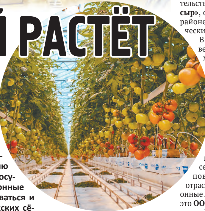
В тепличном комплексе ООО «АгроИнвест».

- Хотелось бы выразить всем инвесторам АПК признательность за веру в наш потенциал, готов- ность разделить с нами существующие риски, соз- дание возможностей для динамичного развития всех аграрных отраслей. Также хочу высоко отме- тить конструктивное сотрудничество банков- ских учреждений и агентства развития бизнеса, которое форсирует инвестиционные процессы в аграрных отраслях. Уверен, что инвестиционный портфель АПК будет прирастать и в дальнейшем не менее динамично, чем в прошлые годы.