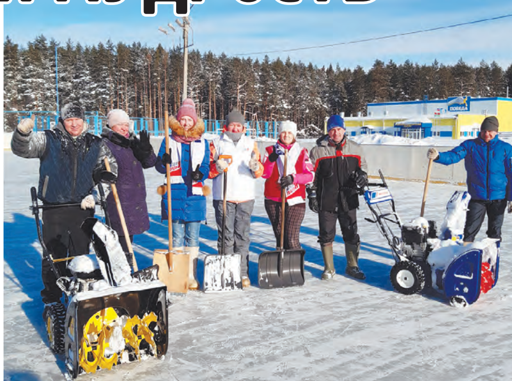
Мосальская молодежь расчистила городской каток на стадионе.

Вот уже седьмой год в муниципалитете действует боевой, действенный общественный союз, который объединяет и учащихся, и работающих людей. На днях члены Молодежного совета собрались, чтобы поговорить о насущных вопросах и планах, сформировать состав нового созыва. В первую очередь подвели итоги работы – это тоже важно. Во встрече принимали участие представители районной власти.