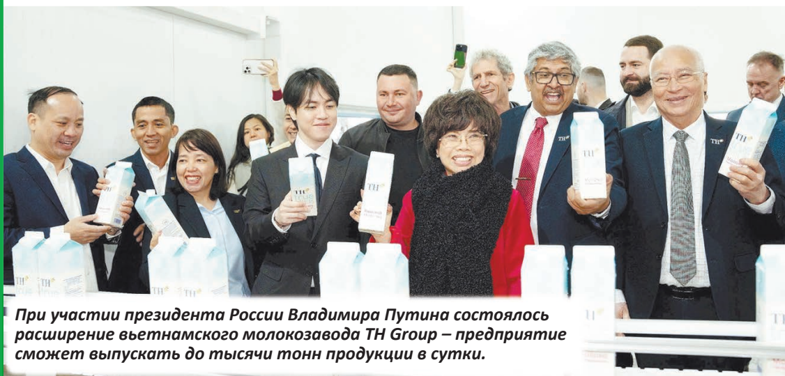
При участии президента России Владимира Путина состоялось расширение вьетнамского молокозавода TH Group — предприятие сможет выпускать до тысячи тонн продукции в сутки.

Благодаря этому формируется доходная часть регионального бюджета — на следующий год в казну поступит более 95 миллиардов рублей собственных доходов, что позволит полностью выполнить взятые на себя социальные обязательства и решать важные задачи, например, в жилищно-коммунальном хозяйстве.