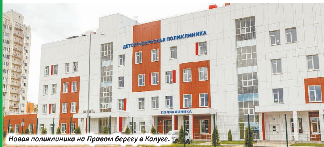
Новая поликлиника на Правом берегу в Калуге.

Привлечение специалистов в отрасль, нуждающуюся, судя по частым вопросам жителей, в кадрах, ведется в области и по программам «Земский доктор» и «Земский фельдшер». Всего в них приняло участие 355 человек. Выполнение плана на этот год уже завершено досрочно – выплаты получил 41 участник. Кроме того, в программу вступило еще пять специалистов. Деньги на их финансирование Минздрав РФ должен направить до конца года. Всего же в 2025 году на работу вышло 90 молодых целевиков, а из других регионов приехало к нам работать 117 специалистов.