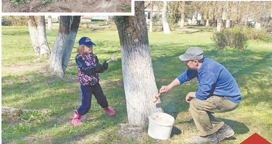
Побелка деревьев в жездрином сквере имени А.С.Елисеева.