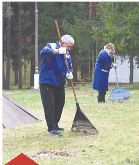
Трудовой десант в Людинове.