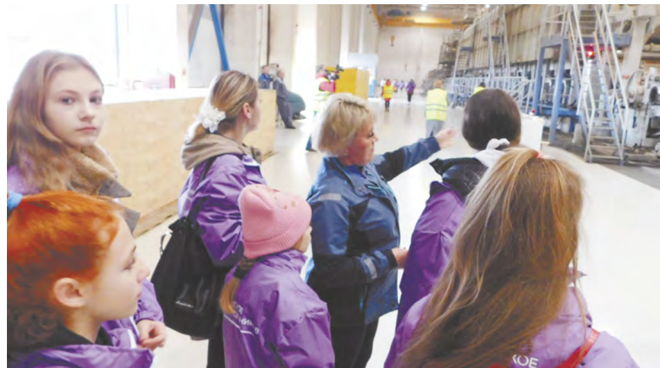
На экскурсии в ООО «ГеоПак» школьники узнали, как из макулатуры производят бумагу и гофрокартон.