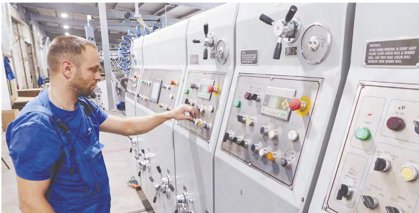
Современные производственные линии предприятий бумажной промышленности требуют хорошей технической подготовки персонала.

В настоящее время в Дзержинском районе удельный вес отгруженной продукции предприятий целлюлозно-бумажной промышленности составляет 20,2 % от общего объема. Ежегодный планируемый рост – выше 105 % .