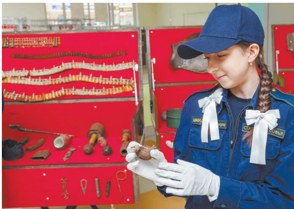
На форуме поисковое общественное объединение имени М.П. Краснопивцева представило редкие экспонаты, найденные в местах сражений Великой Отечественной войны.

В настоящее время в образовательных организациях региона действует 341 музей, из них 304 – школьных. Более 30 школьных музеев являются партнерами Музея Победы на Поклонной горе в Москве. Девять школьных музеев стали участниками Всероссийского образовательного проекта «Музейный час». Более чем в 240 музеях созданы экспозиции, посвященные участникам СВО.