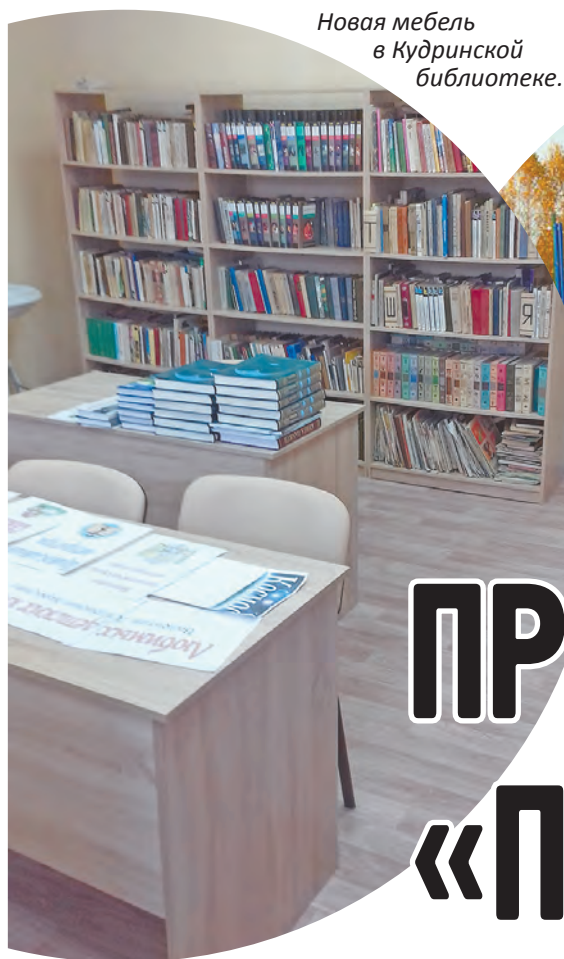
Новая мебель в Кудринской библиотеке.