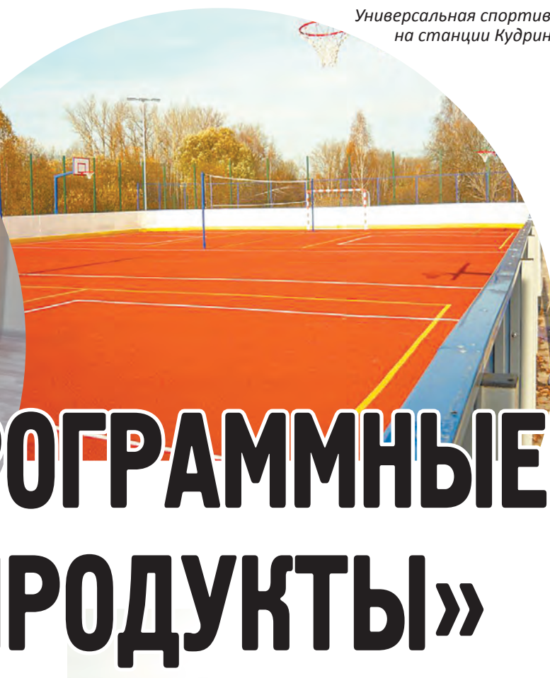
Универсальная спортивная площадка на станции Кудринская.