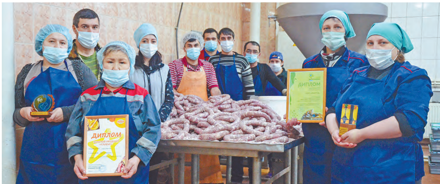
Коллектив колбасного цеха.

И эта награда тоже заслуженная. Внутренний дворик предприятия всегда ухожен, в цехах чистота, здесь соблюдаются все санитарные нормы. Сотрудники и руководство занимаются и благоустройством прилегающей территории. Оказывают помощь поселению. Недавно приняли участие в акции «Вода России». Совместно с представителями министерства природных ресурсов и экологии области, администрации района очистили от мусора два километра береговой линии пруда, расположенного вблизи Кунавы.