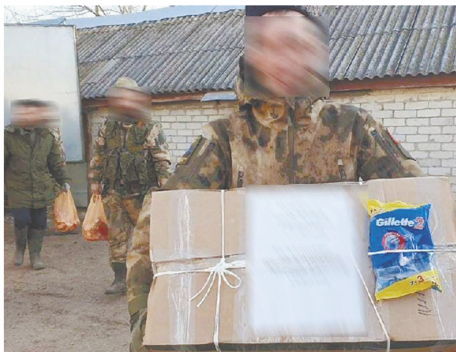
Юхновские казаки с грузом на передовой.

- С момента начала проведения спецоперации наши казачьи общества на регулярной основе оказывают помощь фронту. Мы собираем теплые вещи, медикаменты, продукты длительного хранения и многое другое, что нужно на передовой. Постоянно поддерживаем связь с нашими бойцами, которые сообщают, в чем они нуждаются в данный момент. Каждый груз стараемся сопроводить рисунками и письмами наших кадетов.