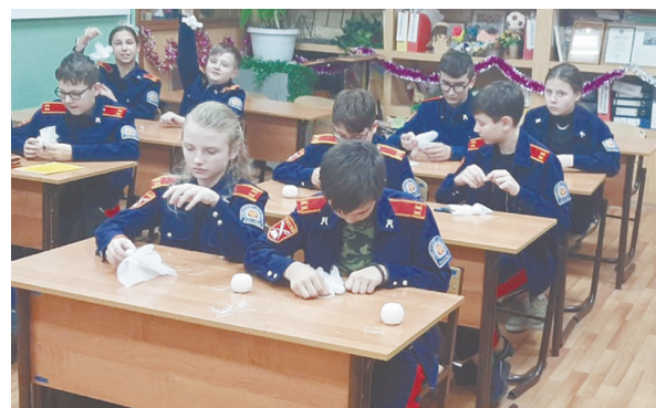
Калужские кадеты изготавливают поделки для участников СВО.

За время реализации госпрограммы планируется обеспечить проведение 60 спортивных, культурных, военно-патриотических и других мероприятий с участием калужского казачества, а также поддерживать казачьи кадетские классы и группы различного профиля, в том числе в составе казачьих кадетских школ, корпусов, учреждений дополнительного образования.