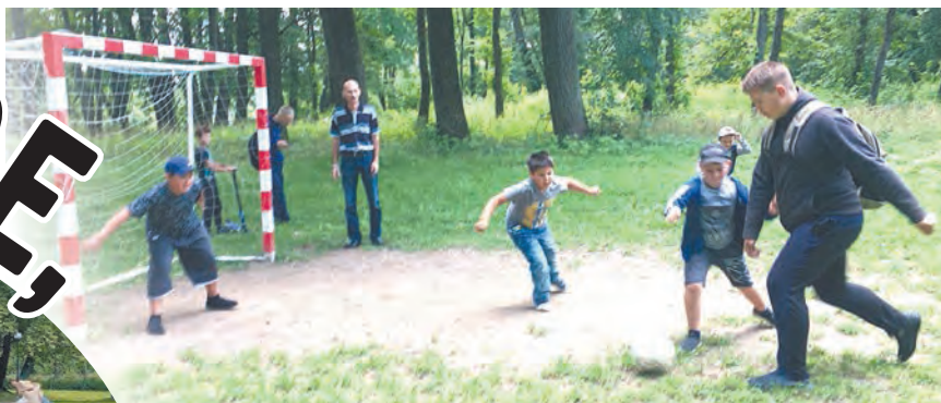
Лагерь «Радуга» в Авчурине.