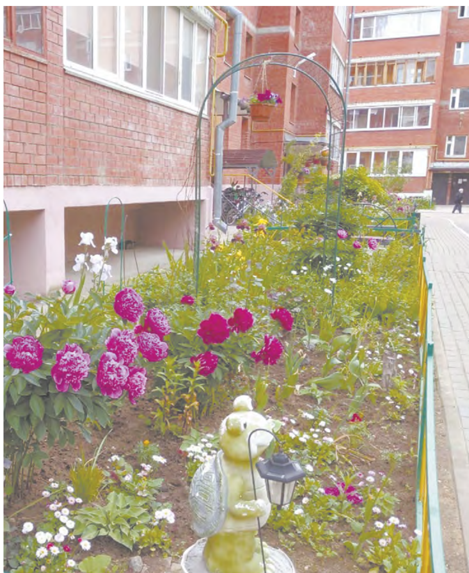
Победитель конкурса 2022 г. — дом 4а по Сиреневому бульвару в Воротынске.

— Если в многоквартирном доме есть актив, который хочет, чтобы жизнь жителей стала комфортнее, интереснее, всегда есть возможность сделать