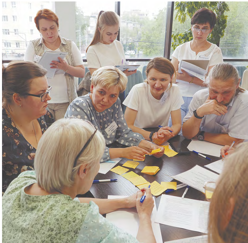
Работа стратегической сессии «Буллинг».

– Калужская область славится открытостью и инновационными подходами в работе с бизнесом, с инвесторами, предлагая опережающие меры и инструменты поддержки, чтобы конкурировать с другими регионами и с другими странами. Это «калужское чудо» во многом стало основой государственной политики, которая реализуется в вопросах привлечения инвестиций в нашу страну, создания благоприятных условий для предпринимателей.