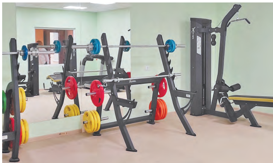
Тренажерный зал в новом физкультурно-культурном центре.

В день торжественного открытия гости осмотрели центр. На первом этаже двухэтажного здания площадью почти 2 тысячи кв. м разместились зрительный зал на 120 мест и репетиционная студия, универсальный спортивный зал на 25 посеще-