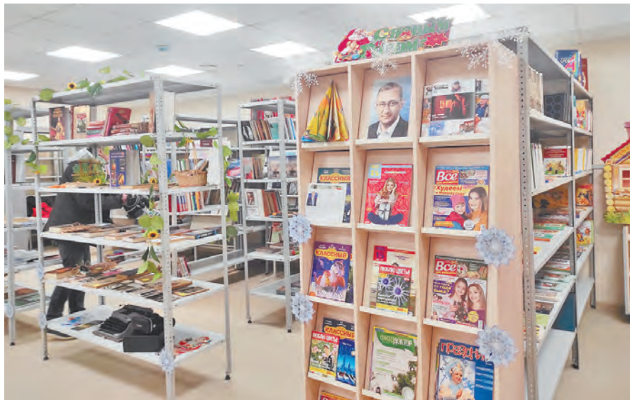
Библиотека на 12 тысяч единиц хранения.

В день открытия ФКЦ в поселке Мятлево губернатор посетил пожарную часть № 36, где пообщался с личным составом, который тоже готовится к новоселью.