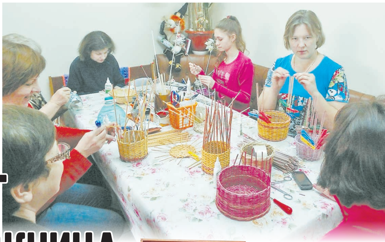
Мастер-класс по лозоплетению.