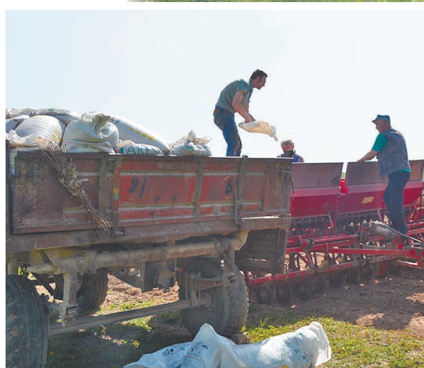
ООО «Родники». Загрузка семян.