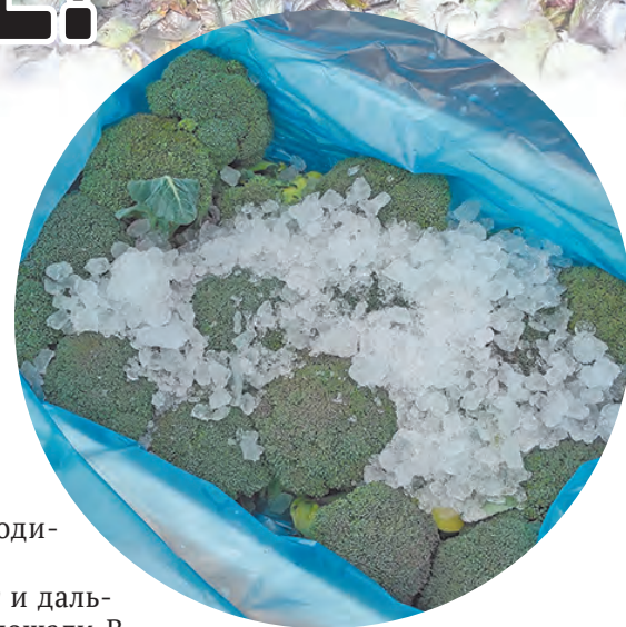
Упакованная брокколи во льду готова к реализации.

Для выращивания рассады и проведения экспериментальных посадок в хозяйстве есть пять теплиц: четыре площадью 700 кв. м и одна 500 кв. м, которая находится на автоматическом отоплении и работает круглый год. Сейчас в ней отработывается технология выращивания