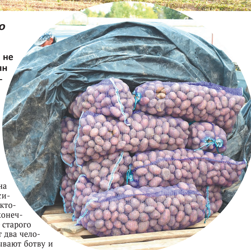
ООО «Флагман». Картофель на продажу.

На переборке трудятся жители близлежащих деревень. Бывают и юхновские. Руко-