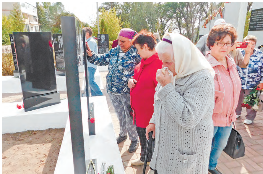
Освящение обновленного сквера.

В этот же день часом ранее здесь прошло посвящение в юнармейцы