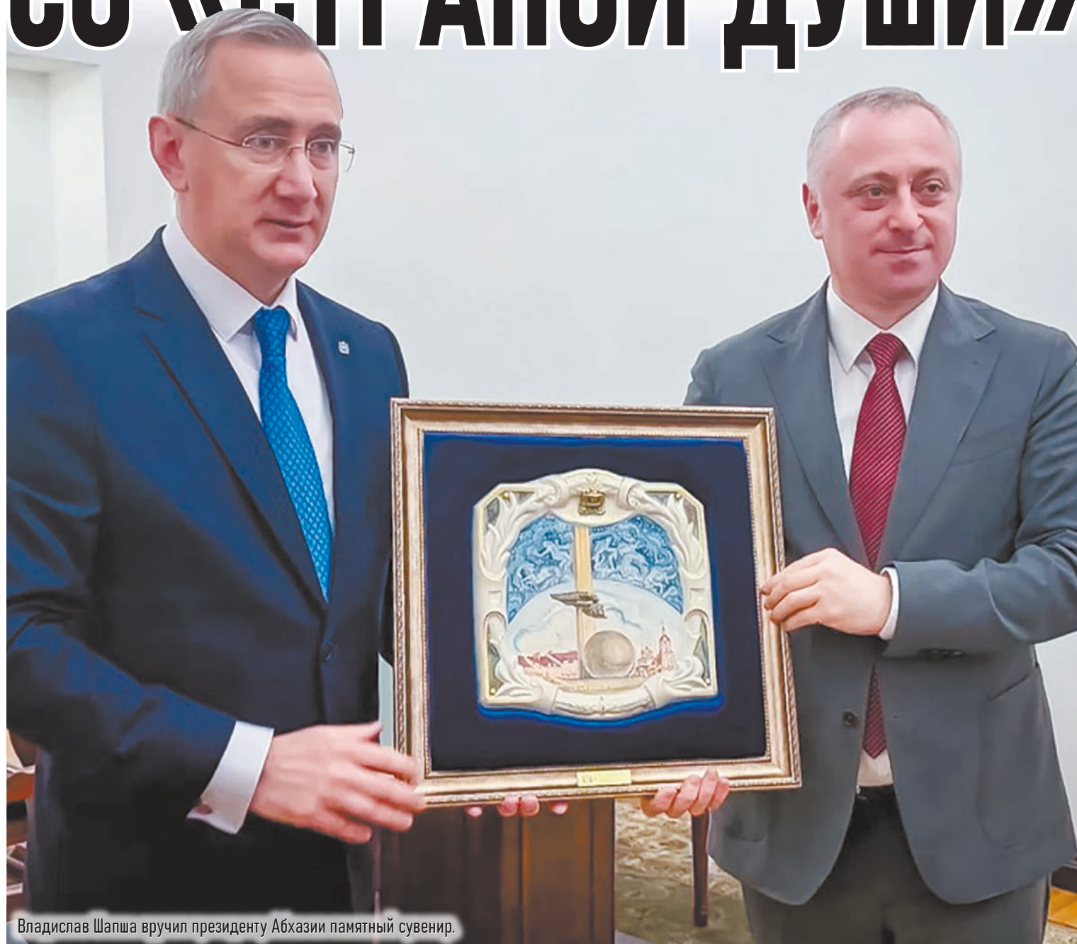
Владислав Шапша вручил президенту Абхазии памятный сувенир.

Делегация области во главе с губернатором Владиславом Шапшой приняла участие в Международном экономическом форуме в Абхазии, где регион представил свой социально-экономический потенциал. В Сухуме Владислав Шапша провел рабочую встречу с президентом Республики Абхазия Бадрой Гунбой, на которой обсуждались перспективы укрепления двусторонних связей, а также подписал меморандум о взаимопонимании между правительствами Калужской области и Абхазии с премьер-министром республики Владимиром Делба.