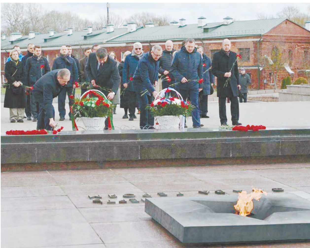
Калужская делегация в Брестской крепости.

2 апреля возобновилось авиасообщение между Калугой и Минском. Калужская делегация прибыла в столицу Беларуси первым рейсом из Калуги, а с 5 апреля началась продажа билетов на регулярные рейсы. Они будут выполняться по средам.