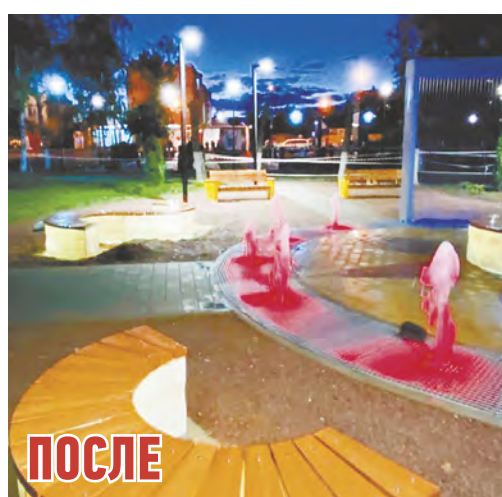
Ермолино. Фонтан на Центральной площади.