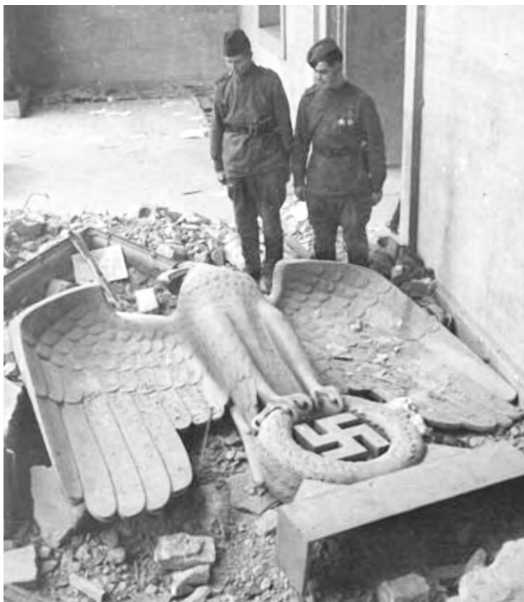
Советские солдаты у входа в рейхсканцелярию в Берлине. Май 1945 года.