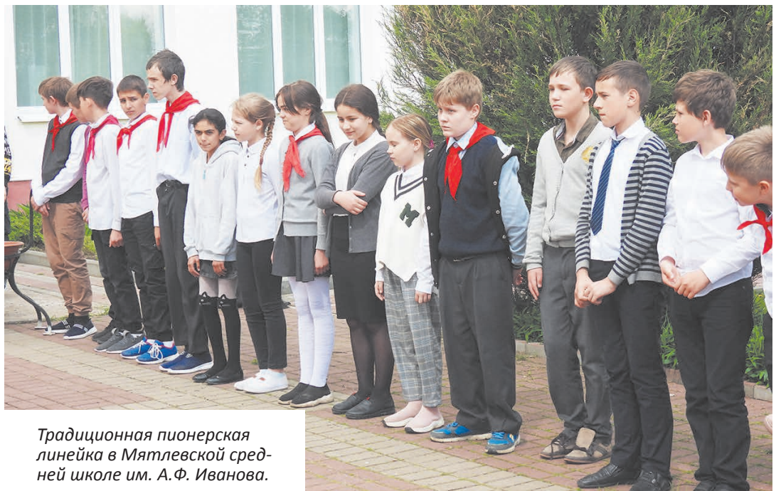
Традиционная пионерская линейка в Мятлевской средней школе им. А.Ф. Иванова.