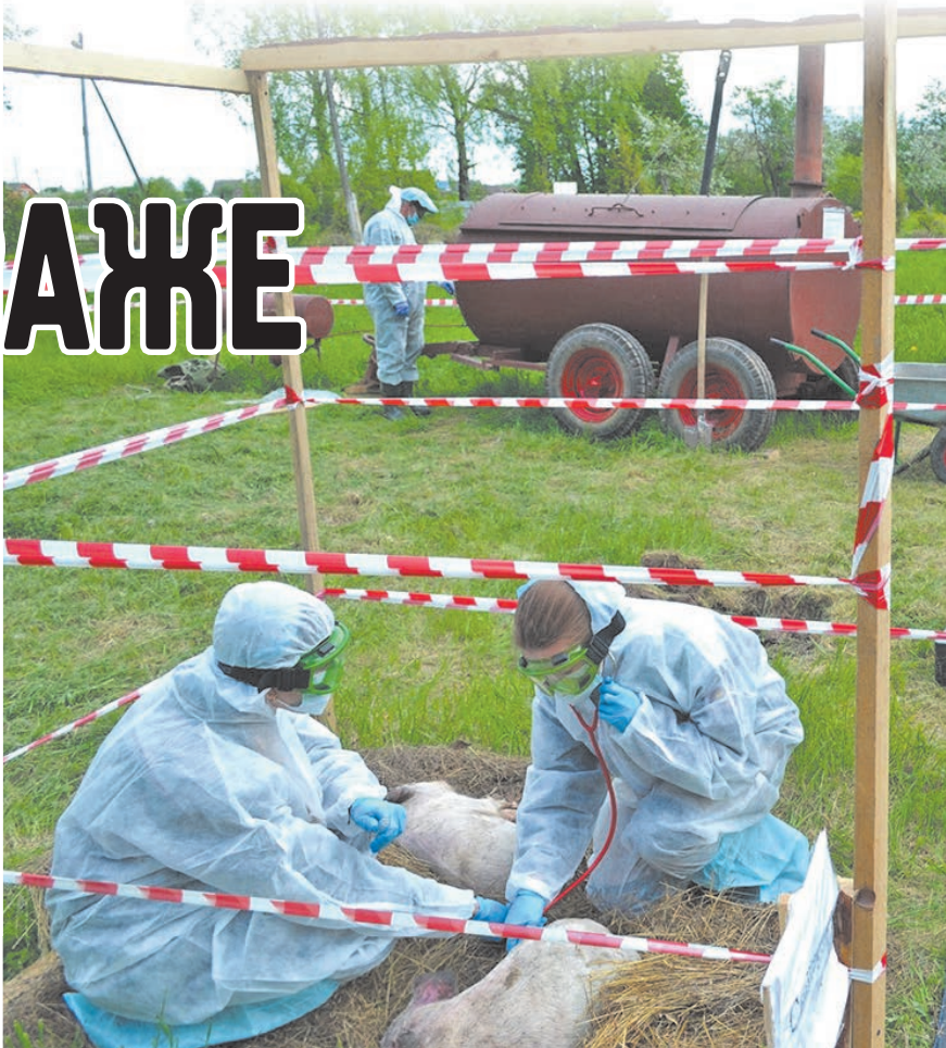
Диагностика АЧС в полевых условиях.

Конец мая для специалистов госветслужбы был ознаменован выездными учениями в несколько районов области, где айболиты показали свою готовность по выявлению возбудителей особо опасных болезней животных, их предупреждению, схемам взаимодействия с местными органами власти и оповещению сельского населения.