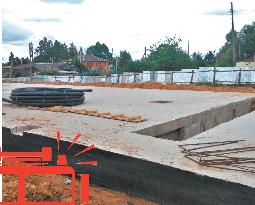
Фундамент под модульную конструкцию здания готов.

В новом пожарном депо общей площадью 408 квадратных метров разместятся две спецмашины повышенной проходимости. Установят необходимое для работы пожарно-техническое оборудование, оснастят пункт связи, смонтируют очистные сооружения для ливневки. Также предусмотрена комната отдыха, места для служебных и бытовых помещений. У здания появится вышка из металлоконструкций. В учебно-спортивной зоне разместится тренировочная 12-метровая башня со скалодромом