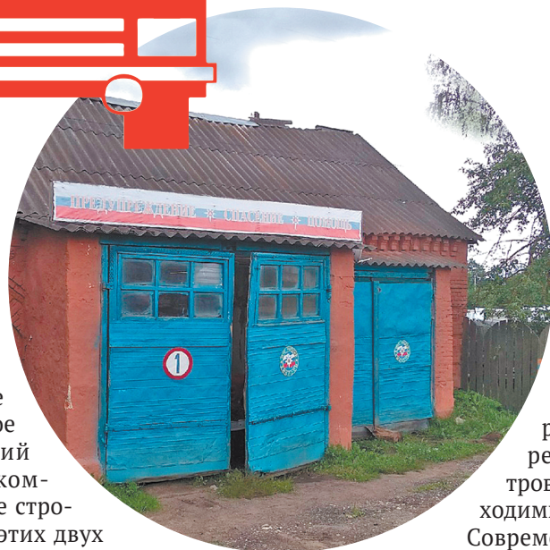
Столетнее действующее здание в поселке Мятлево, в котором размещается ПЧ № 36.

и лестницей, где можно будет отрабатывать действия при пожаре и других чрезвычайных ситуациях. Также на территории депо установят резервуар на 100 кубометров воды, подведут все необходимые коммуникации.