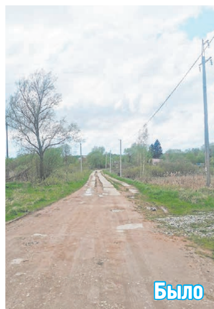
Дорога у деревни Слобода.

направляющего слоя, нижнего и верхнего слоев асфальтобетонного покрытия, восстановили заездные карманы и тротуары, а также укрепили обочину щебнем. Также установили восемь автопавильонов, дорожные знаки и бордюр. Помимо этого нанесли разметку и заменили металлические ограждения и сигнальные столбики.