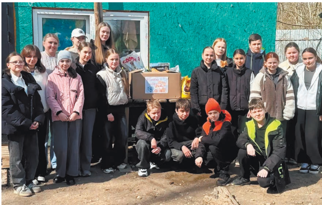
Дети - постоянные добрые друзья пункта передержки.

Все животные в приюте под медицинским наблюдением. Вновь прибывших собак не запускают в общие вольеры, пока не пройдет период «карантина» - в это время они проживают на отдельно огороженной территории.