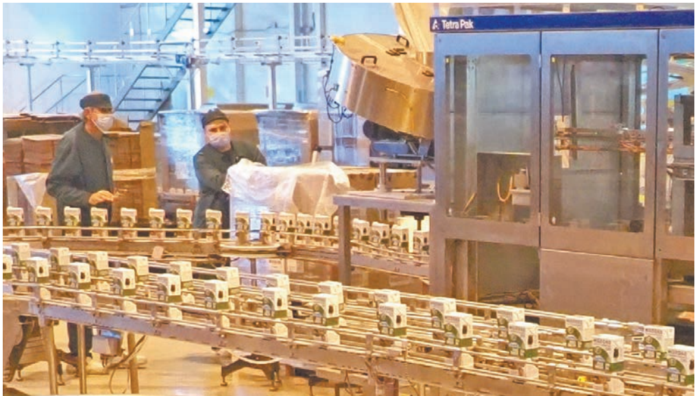
Производство молока на заводе в Медыни.