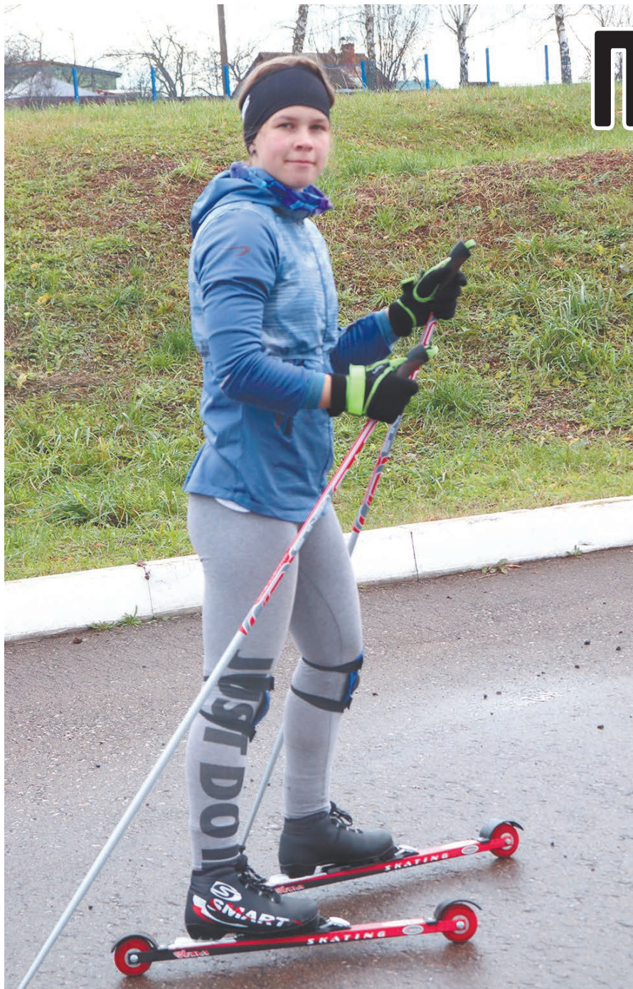
Окончание. Начало на 1-й стр.