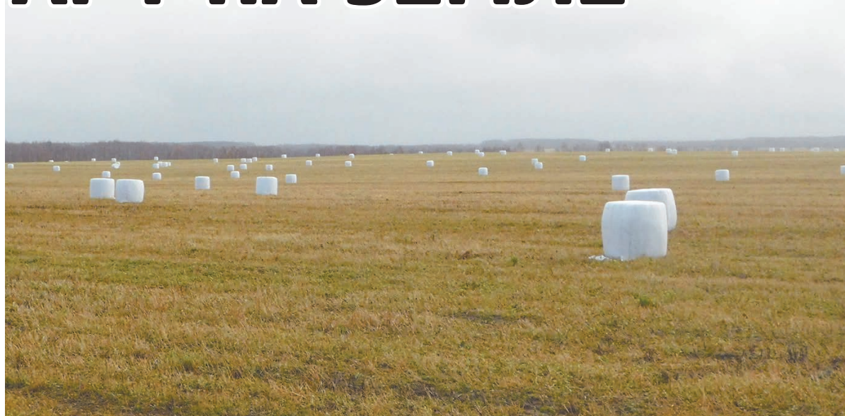
Ухоженные поля всегда радуют глаз.

В этом ангаре вскоре начнут устанавливать оборудование.