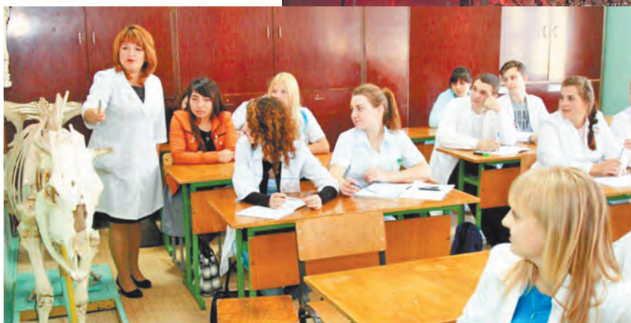
Урок в группе ветеринаров.

Шли годы, число обучающихся росло. На 1 сентября 1966 года контингент обучающихся составлял 645 человек на очном отделении и 416 на заочном. В 1970 году переименован в совхоз-техникум «Калужский», в 1992 году – в совхоз-колледж «Калужский», 4 ноября 2000 года – в Калужский аграрный колледж, 17 июля 2015 года – в Калужский колледж народного хозяйства и природообу-