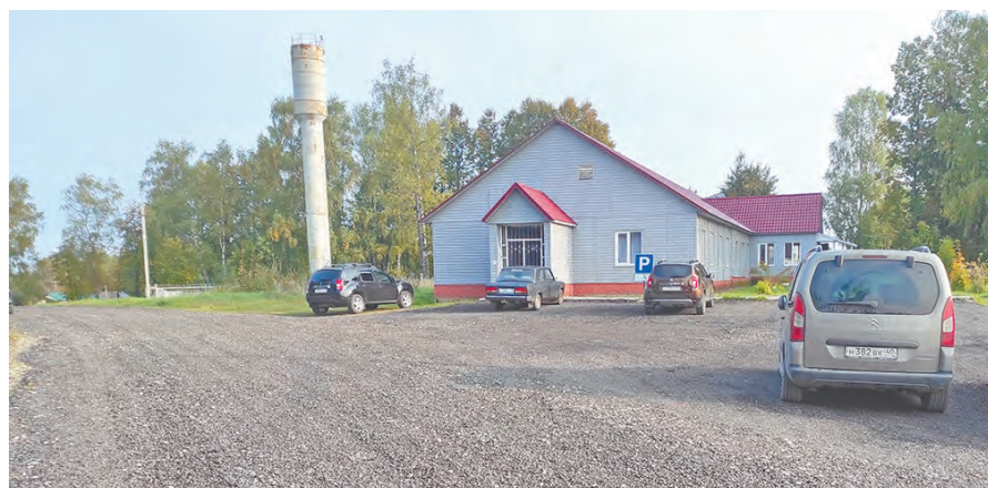
Отсыпка дороги асфальтовой крошкой на улице 40 лет Октября.