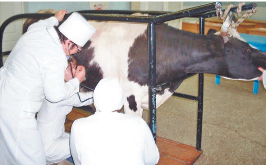
Работа ветеринаров на ферме.

ветеринарных правил. Замминистра рекомендовал для сокращения экономических потерь проводить внеочередное заседание противоэпизоотической комиссии в течение суток при подтверждении диагноза особо опасного заболевания животных.