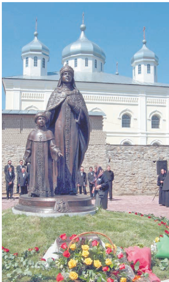
Памятник русской царице Евдокии Стрешневой в Свято-Георгиевском монастыре.