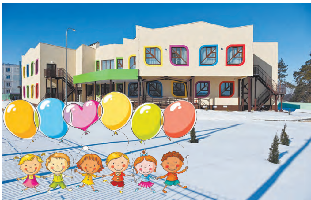
Детский сад «Родничок» – один из лучших в области.