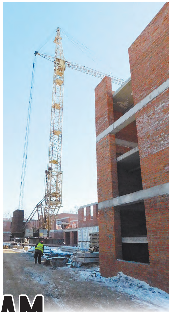
Строительство новой кондровской школы №1 идет полным ходом.

Глава региона побывал на строительстве нового здания кондровской школы № 1. Школа на 1000 мест будет сдана к ноябрю 2021 года в рамках нацпроекта «Образование» и регионального проекта «Современная школа». Белорусский подрядчик готовит объект со всем необходимым оборудованием, отвечающим современным стандартам.