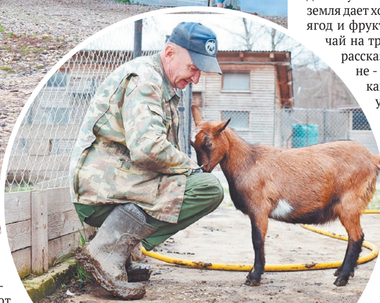
Козы здесь почти ручные.

В хозяйстве абсолютно все натуральное. Здесь не используют удобрения и гербициды, специально