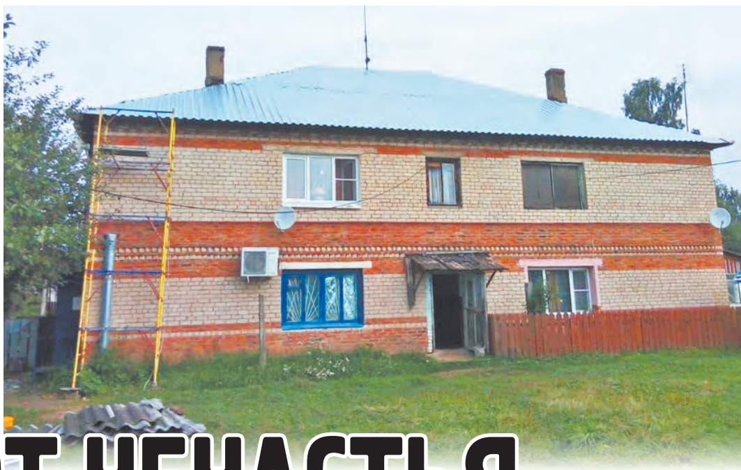
Обновленная четырехскатная крыша в доме № 6 на улице Мира в деревне Хвощи.

Средства на обновление кровли в доме № 6 на улице Мира в деревне Хвощи и дома № 36 на улице Центральной в деревне Ореховня, в которых большинство квартир являются муниципальной собственностью, выделены из бюджета района. А дом № 42 на улице Крупской в Износках отремонтирован за счет средств регионального Фонда капитального ремонта.