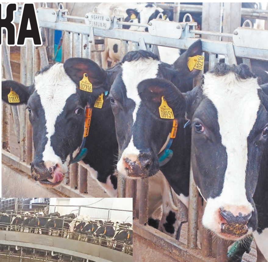
На ферме ООО «Калужская нива».

Благодаря системной государственной поддержке, способствующей росту инвестиционного потенциала молочного животноводства, совершенствованию кормовой базы и повышению генетического потенциала скота производство молока в области стабильно растет.