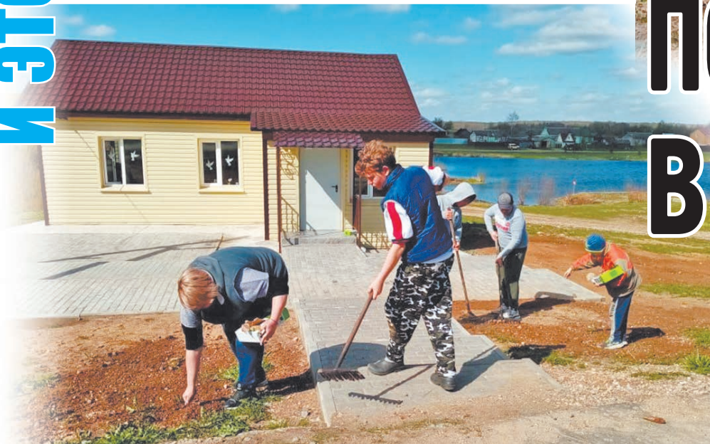
Благоустройство территории обновленного ДК.

Извольское сельское поселение – небольшое муниципальное образование в Истринском районе с численностью населения примерно три сотни человек. Но здесь очень богатая история, дружные и трудолюбивые жители, деятельные и неравнодушные руководители, что помогает этой земле становиться современнее, благополучнее.