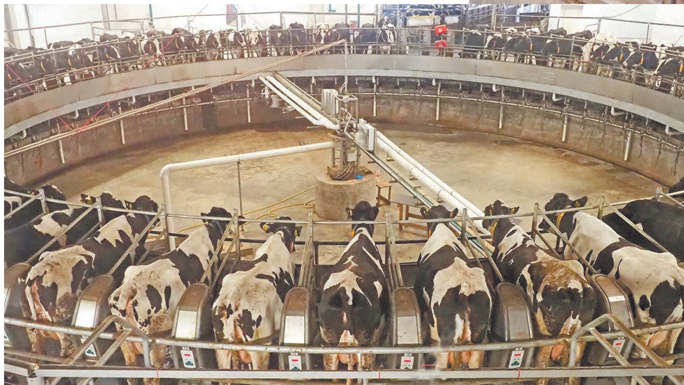
Доение коров в ООО «Русский сыр».

Производство коровьего молока в сельхозорганизациях нашей области увеличилось на 8 % по сравнению с прошлым годом. Заметно выросли показатели и по наиболее полезному козьему молоку – 127 % к прошлому году.