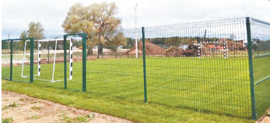
Детские игровая и спортивные площадки в деревне Михали.

Раньше в распоряжении местных ребятшек во дворах было лишь несколько игровых конструкций, которые давно устарели и не соответствовали современным нормам и требованиям безопасности. Теперь же юные жители могут весело и интересно проводить досуг в комфортных условиях. Площадка включает в себя и детский городок, и места для занятий спортом. Малыши могут играть в песочнице, кататься с горочек и на качелях, а ребята постарше заниматься волейболом, баскетболом и мини-футболом. Взрослым тоже хорошо – пожалуйста, присаживайся на лавочку,