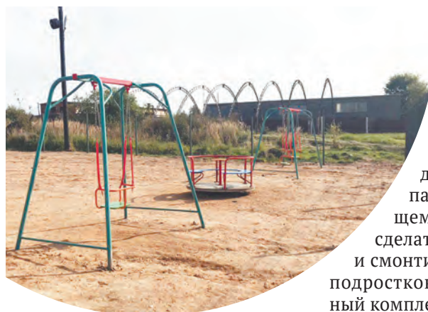
Новая детская площадка в Износках.