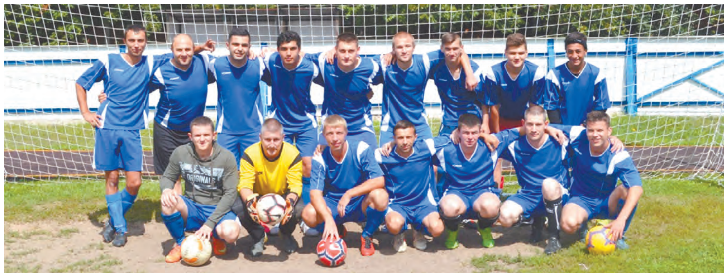
Сборная Юхновского района по футболу 2019 год.