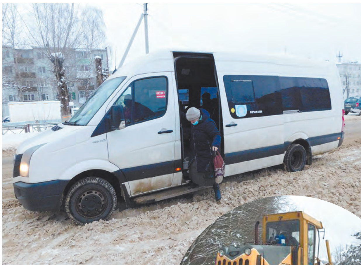
Снежная каша мешала и транспорту, и пешеходам.