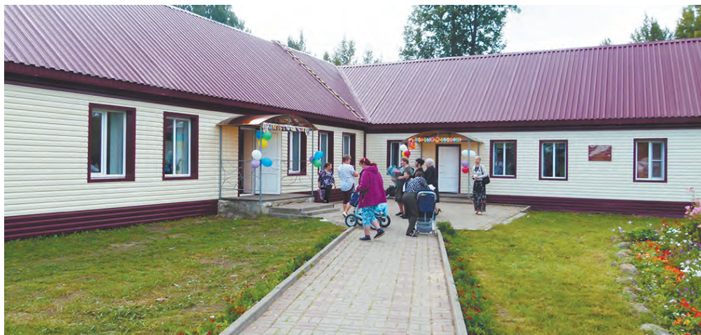
Обновленное здание школы в Извольске.