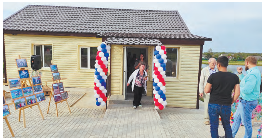
Сельский Дом культуры после капитального ремонта.

Возможность возвести новую школу на 60 мест, построить станцию водоподготовки и провести реконструкцию водопроводных и канализационных сетей появится