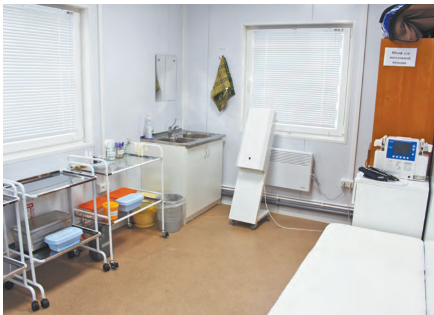
Внутреннее оснащение медпункта.