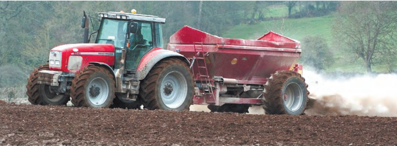
Известкование почвы на дачном участке.

этом следует исходить из расчета, чтобы на квадратный метр при самом кислом почвенном растворе (рН ниже 4) приходилось 0,5-0,6 кг мелиоранта, при сильно кислом (рН 4) – 0,4-0,5, кислом (рН 4,5-5) – 0,3-0,4 и умеренно кислом (рН 5,5-6) – 0,25-0,3. После этого нужно внести органические удобрения и почву перекопать. Благодаря дождям известь поступит в те слои почвы, где располагаются корни культурных растений. Это обеспечит почву и растения необходимыми веществами на срок от 5 до 10 лет.