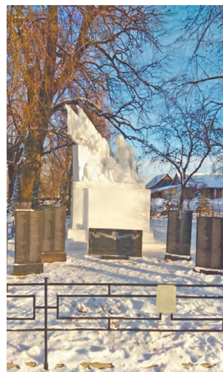
Братское захоронение в селе Шанский Завод.

В этом году памятные таблички сделаны на семи воинских захоронениях, увековечены еще около сотни имен освободителей Из-