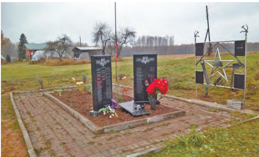
Братское захоронение в деревне Голенки.

Обновленное братское захоронение в деревне Криково.