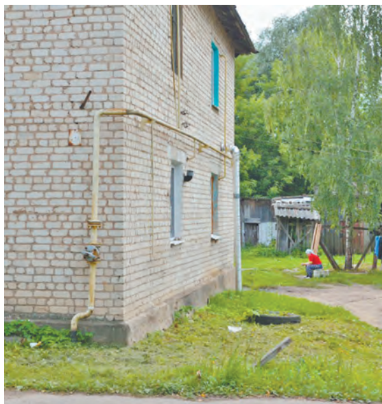
Дом № 29 по улице Калужской.