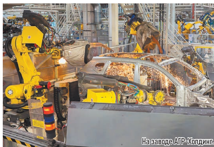
На заводе АГР-Холдинг.

учно-производственный центр, работают 15 производителей дронов и комплектующих.