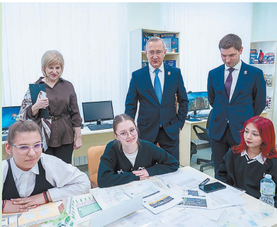
Подготовили Нина ЗАМАХИНА, Андрей ГУСЕВ.

– Видно, что ученики и педагоги очень довольны теми изменениями, которые открывают новый уровень возможностей для развития детей, – отметил губернатор.