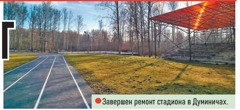
● Завершен ремонт стадиона в Думиничах.

В Думиничах на мемориале памяти у братской могилы воинов-освободителей прошли масштабные работы: установили барельефную стену, расширили территорию, уложили новую плитку, сделали освещение. Площадь стала просторнее, красивее. А главное – в результате поисковой работы дополнили списки красноармейцев, погибших в боях за освобождение Думиничской земли, их имена занесли на мемориальные плиты.