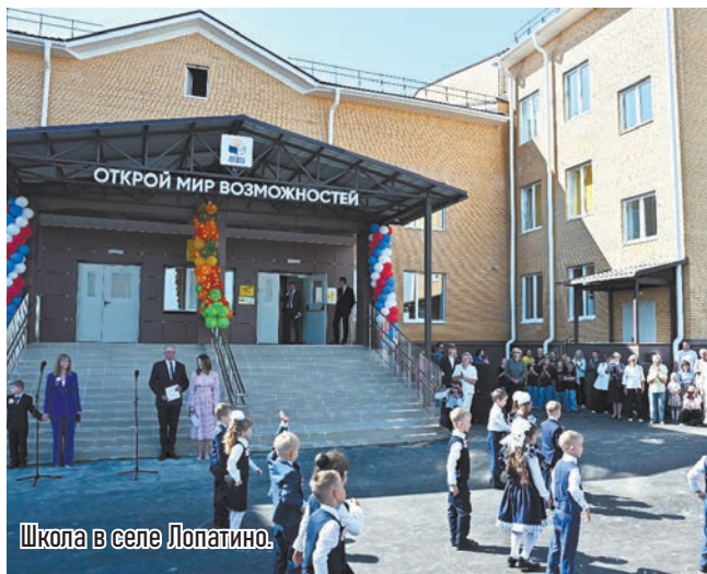
Школа в селе Лопатино.

● В прошлом году открыты детские сады в Ферзиковском округе и Обнинске, новая школа в селе Лопатино Тарусского округа. Строятся школы на 1125 мест в микрорайоне Тайфун и на 300 мест во Мстихине в Калуге. Они откроются в следующем году. Как и два детских сада на Правобережье областного центра.