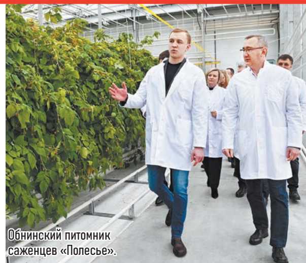
Обнинский питомник саженцев «Полесье».

● За 10 лет доля используемой пашни выросла с 50 до 70% . В этом году планируется ввести еще 20 тысяч гектаров. По эффективности муниципального земельного контроля область занимает второе место в России.