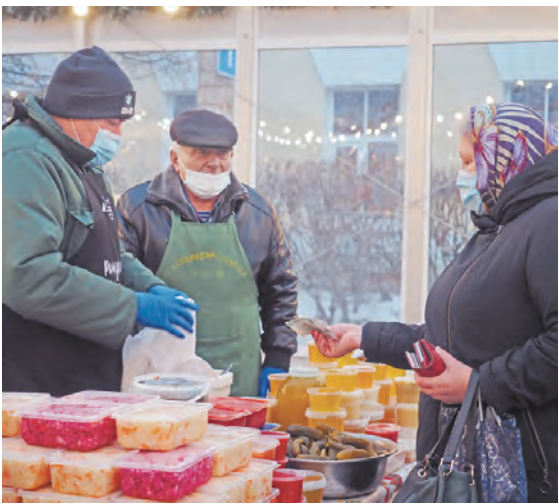
Все, кто посетил эту предновогоднюю ярмарку, уходили домой не только с покупками, но и с прекрасным настроением.