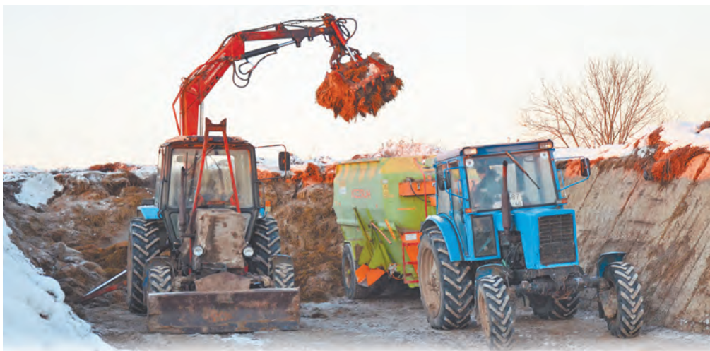
ООО «Родники». Загрузка миксера на яме.