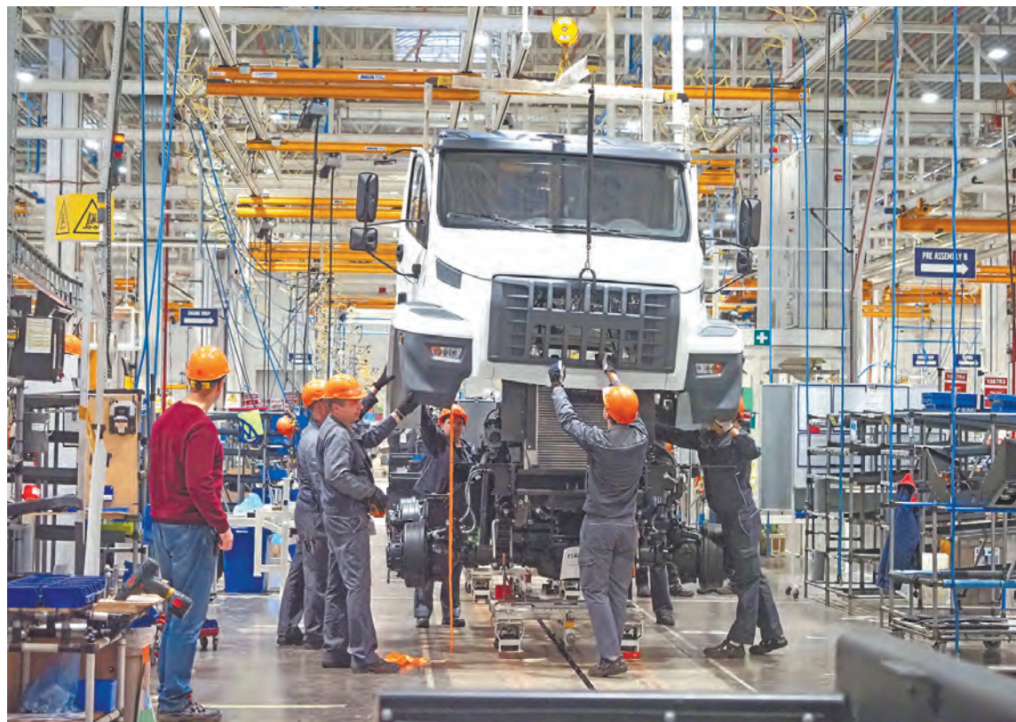
Сборка грузовиков на заводе АМО.

– По итогам 2023 года объем промышленного производства составил более 925 миллиардов рублей. Мы смело говорим о росте в этом направлении на 2 процента. И это не предел для дальнейшего увеличения выпуска нашей промышленной продукции. Для этого созданы все необходимые условия.