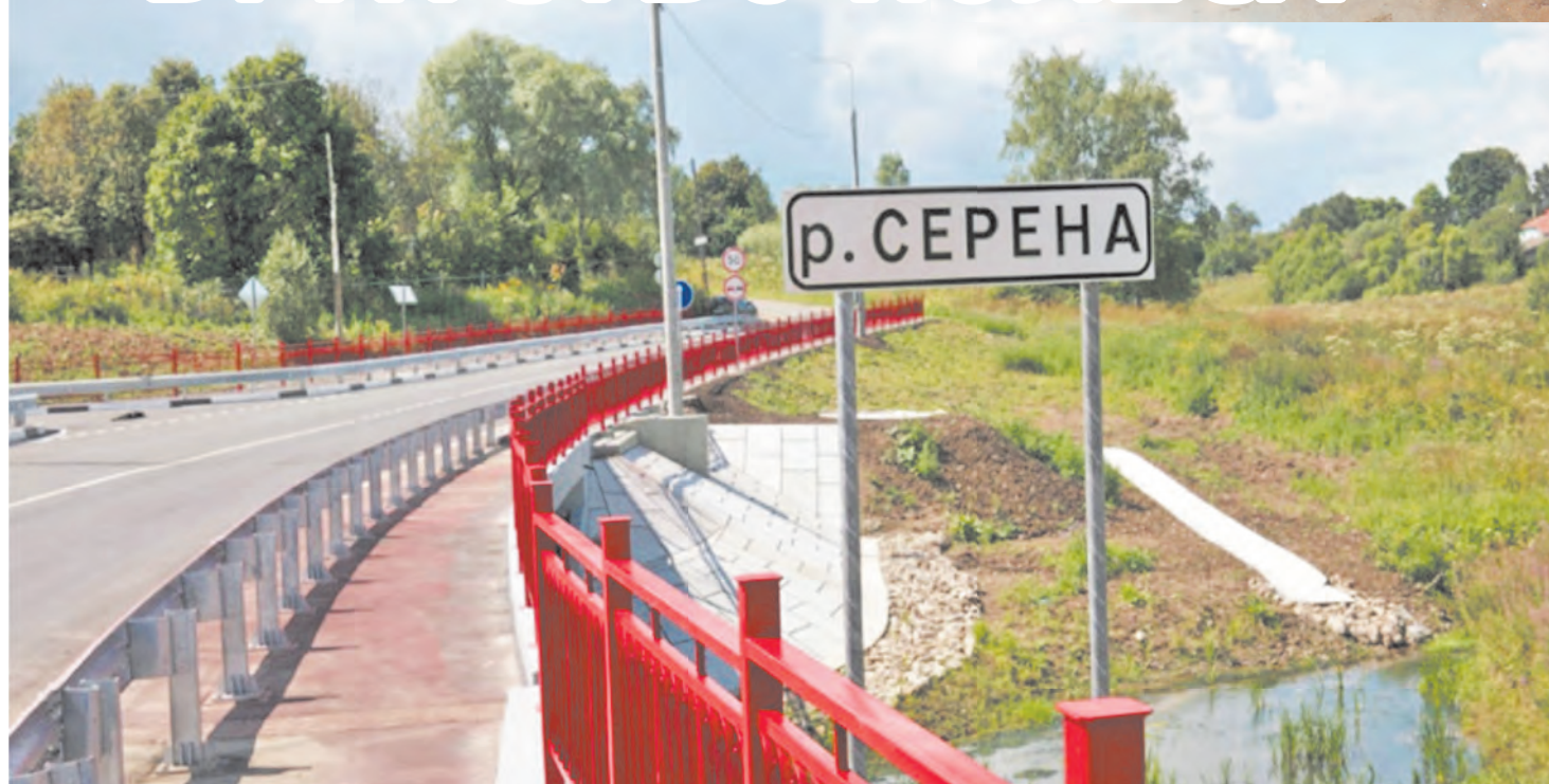
Ремонт дороги деревня Баранцево - посёлок Баранцево.

Большое внимание уделяется обеспечению безопасности дорожного движения. Региональное министерство дорожного строительства выделило району субсидию для обустройства в Мещовске парковочных мест по улице Освободителей (около школы) и бордюров на улице Юбилейной (возле ярмарки выходного дня) для дальнейшей разбивки здесь тротуаров с целью безопасного передвижения пешеходов.