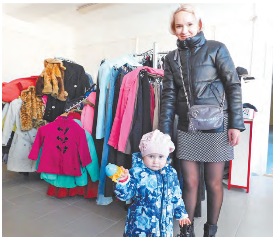
В этом магазине улыбаются все.