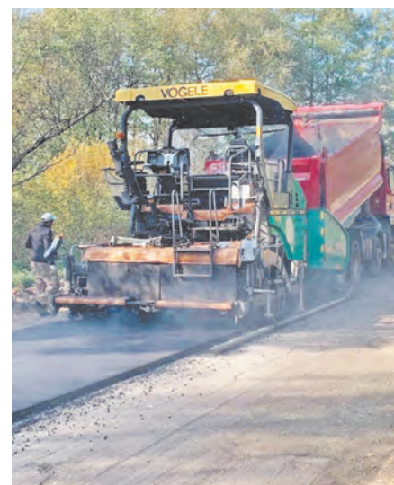
Ремонт дороги от Киевской автотрассы к посёлку Молодёжный.