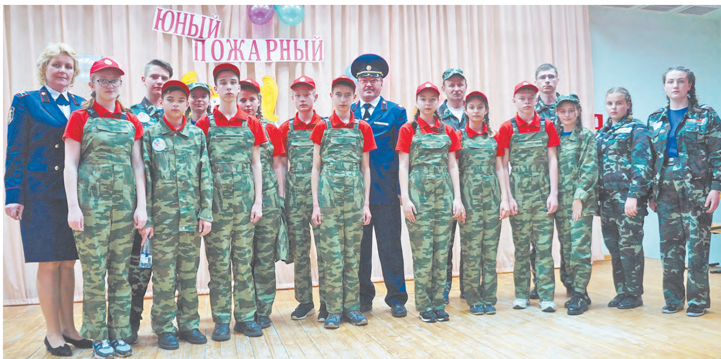
Дружина юных пожарных «Радуга».