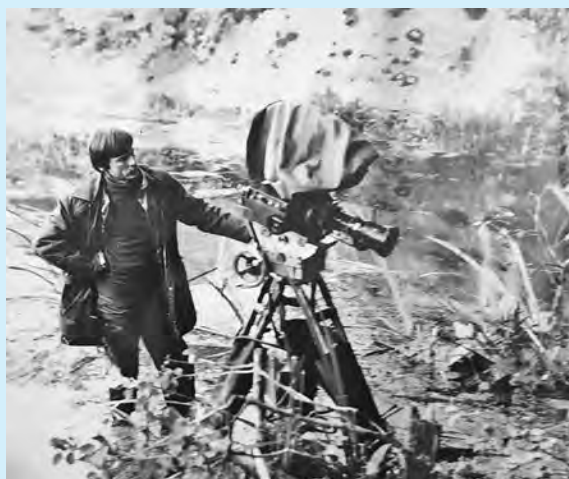
Андрей Тарковский на съемках фильма «Сталкер». 1978 г.

Произведения Арсения Тарковского, романсы на его стихи и стихи русских поэтов прозвучали в исполнении певицы Инны Разумихиной и заслуженного артиста России, актера и режис-