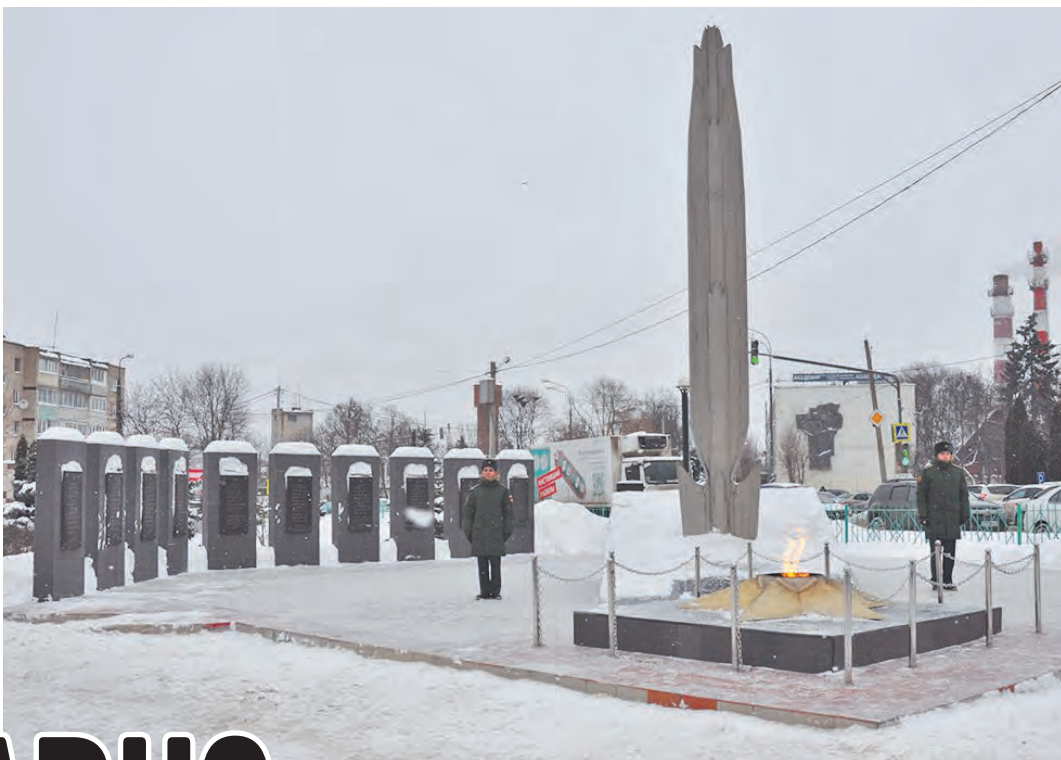
У мемориала в сквере Победы в Балабанове.

Район был оккупирован подразделениями гитлеровской армии с 14 октября 1941 года по 12 января 1942-го. По сравнению со многими другими районами и населёнными пунктами Советского Союза, казалось бы, недолго. Но каждый день, каждый час вражеского пребывания на Боровской земле был отмечен для местных жителей той поры кровью, болью, горем и потерями.