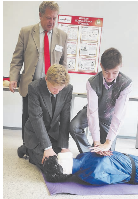
Урок ОБЖ в Износковской школе.