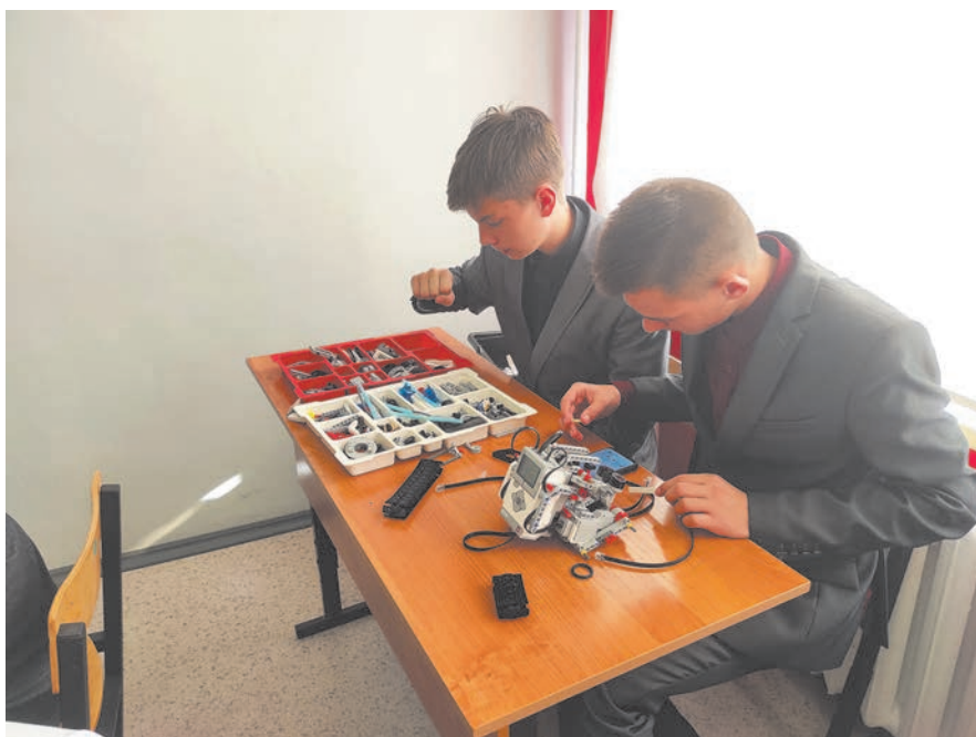
В Износковской школе появился кружок «Робототехника».

В одном из классов ребята показали, как собирают робота, реагирующего на управление пультом звуками и движением. Разработанной автоматизированных технических систем с удовольствием