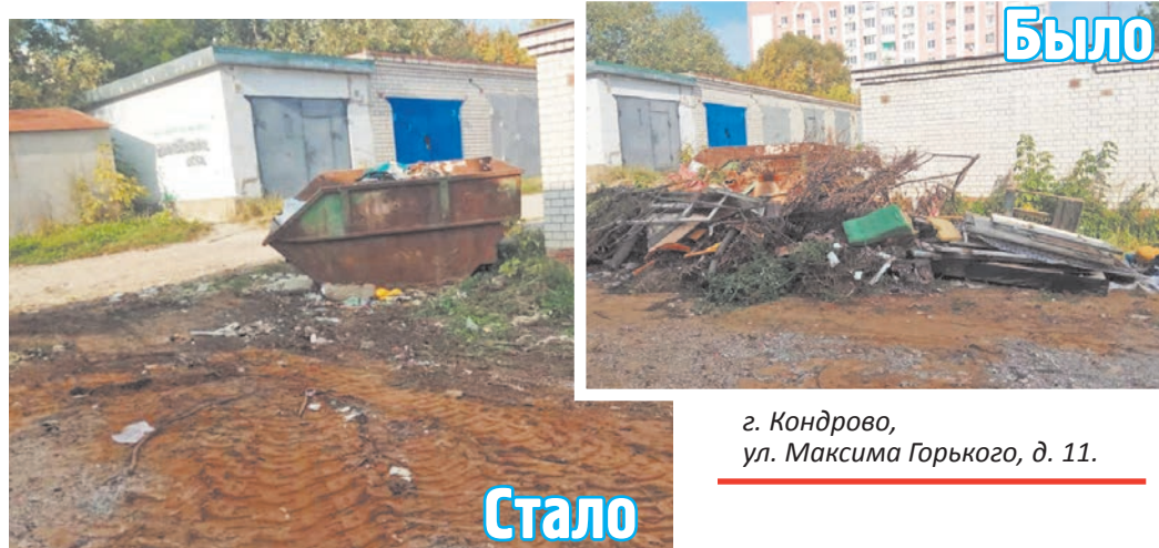
г. Кондрово, ул. Максима Горького, д. 11.

Государственное предприятие «Калужский региональный экологический оператор» (КРЭО) в сентябре проделало большую работу по устранению очагов несанкционированного складирования мусора в Кондрове. Специалисты хорошо потрудились, но проблема предупреждения образования таких завалов так и не находит пока решения.