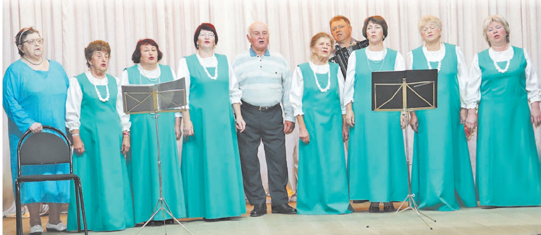
Клуб ветеранов «На волне памяти» в Мещовске открыл юбилейный сезон