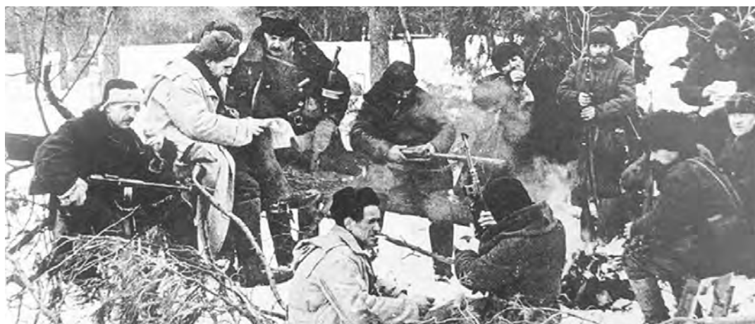
Партизаны отдыхают после боя.

Первый бой на Калужской земле состоялся 2 октября 1941 года. Последний враг был выбит 17 сентября 1943 года