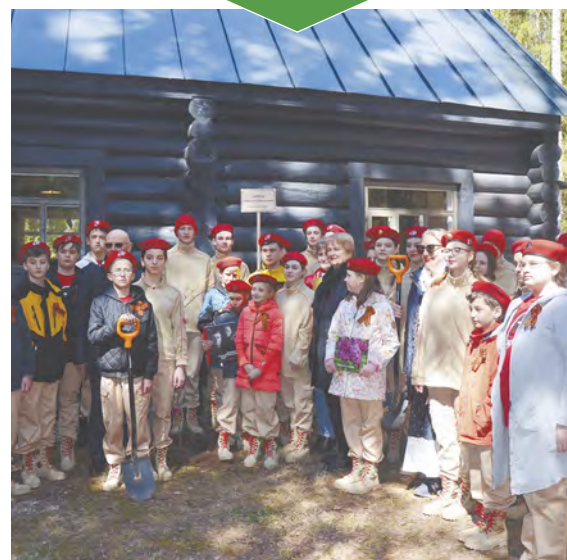
Подготовила Татьяна КОНДРАТЬЕВА.

Сажать сирень помогли юнармейцы из Беляевской школы. Для них встреча с внучкой маршала стала незабываемой. Теперь они вместе с сотрудниками нацпарка «Угра» будут ухаживать за саженцами.