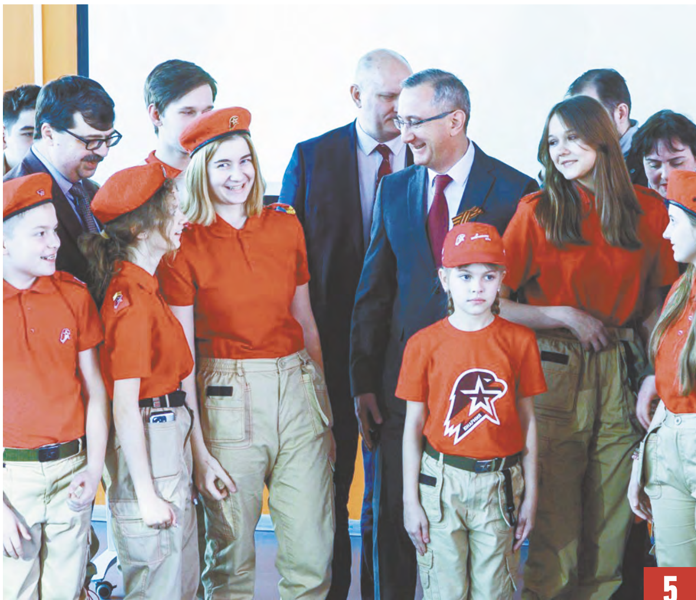
На церемонии награждения победителей конкурса с юнармейцами.

Региональный конкурс «Символ калужской доблести» был организован, чтобы создать концепцию шеврона для нашего подразделения в зоне СВО - Калужского тяжелого гаубичного дивизиона имени