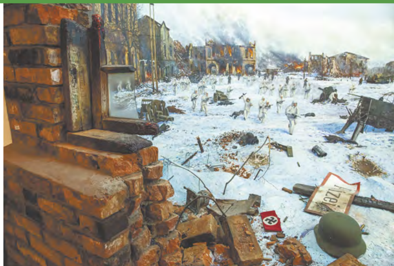
Диорама «Освобождение Юхнова» в военно-историческом музее.

Осенью 1941 года немцы начали наступление на Москву. Вражеские танки ворвались в Юхнов на рассвете 5 октября. Город стал плацдармом для наступательных операций на Малоярославец и столицу. Вскоре район был полностью оккупирован. Фашисты считали, что от Юхнова до Москвы им сутки ходу. Но продвижение врага к столице не было столь легким, как казалось вначале. Уже на Угре гитлеровцы споткнулись. Десантники Старчака и подольские курсанты на целую неделю(!) задержали продвижение частей четвертой полевой армии врага. 8 октября свой горящий самолет направил на мост через Угру капитан Алексей Рогов, надолго парализовав переправу. В начале декабря 1941 года Красная армия перешла в контрнаступление под Москвой. Всю зиму 1942 года шли упорные бои в окрестностях Юхнова и на территории района. Враг не отдавал без боя ни одного метра Юхновской земли. Только 5 марта ударные группировки вошли в Юхнов. Ожесточенные бои на территории района продолжались еще 365 дней. Особенно кровопролитными были они на Суковском и Павловском плацдармах. В районе деревни Суковка бойцы 133-й дивизии почти год удерживали крохотный клочок земли, за стойкость и мужество названный «Маленьким Севастополем». Обильно политую кровью землю у деревни Павлово, которую обороняли подразделения 194-й стрелковой дивизии и Тульского рабочего полка, позже назовут «Малой землей». Именно с Павловского плацдарма началось наступление советских войск. И в марте 1943 года Юхновский район был полностью освобожден.