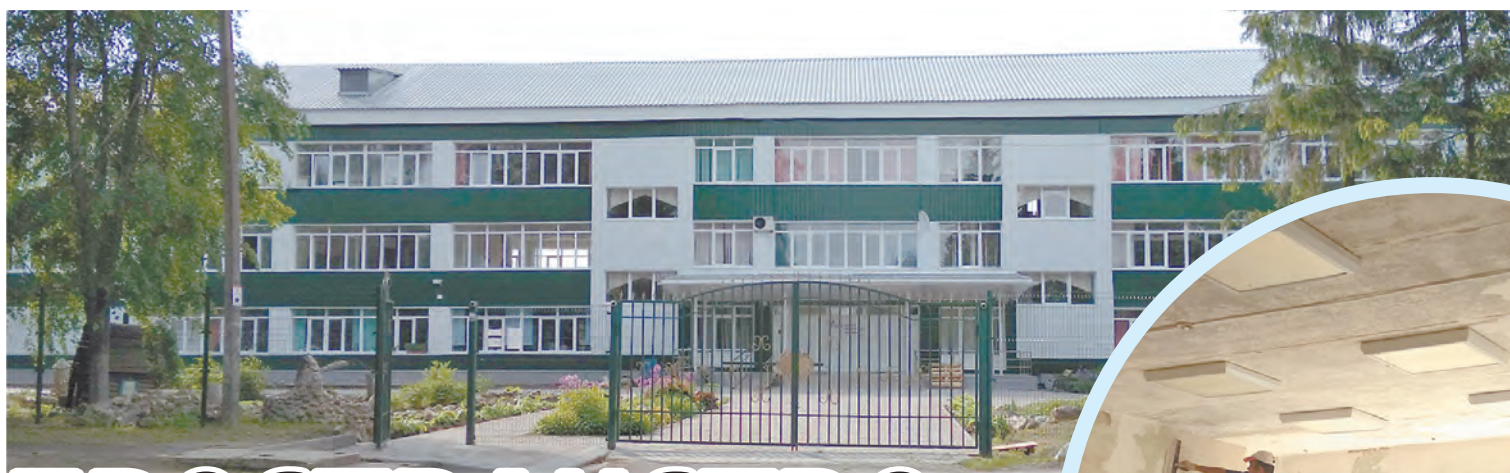
Ремонт классов, предназначенных для «Точки роста» в Износковской школе.