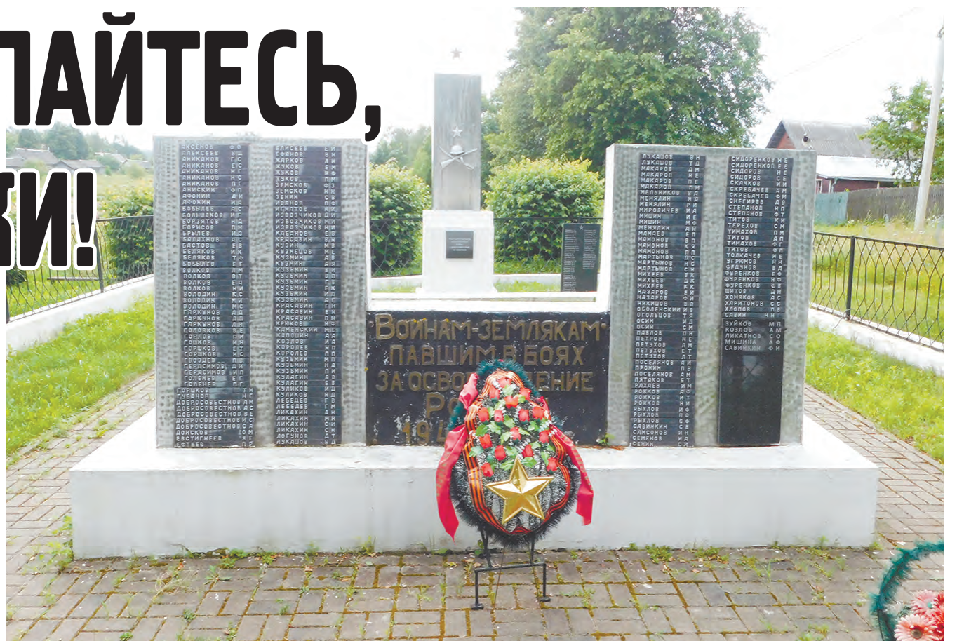
Мемориал в честь земляков, погибших на фронтах Великой Отечественной войны.