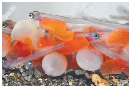
Мальки форели из икринок востребованы по всей стране.

На территории района продолжает работать ООО «Селекционный центр аквакультуры» по производству малька радужной форели. За 2020 год компанией произведено более 7 млн мальков, предназначенных для реализации в качестве посадочного материала. Выращенные из икры, они востребованы рыбобоводными хозяйствами нашего и других регионов (например, крупными форелевыми предприятиями северо-запада РФ). В компании создано 46 рабочих мест с самой высокой по сельскохозяйственным предприятиям области средней заработной платой – 90 тысяч рублей.