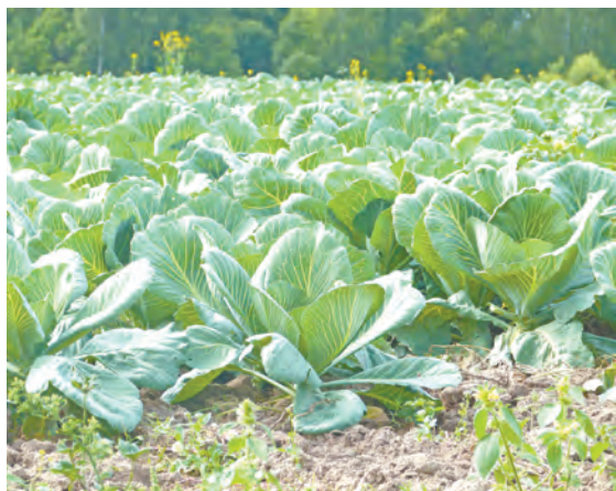
КФХ «Капаларан Д.С.» стало первым в регионе среди производителей овощей открытого грунта.

К примеру, в прошлом году были созданы четыре крестьянско-фермерских хозяйства в поселке Мятлево, деревнях Дороховая и Алексеевка. В рамках федерального проекта «Создание системы поддержки фермеров и развития сельской кооперации» они будут реализовывать свои проекты по круглогодичному выращиванию овощей в теплицах, малины, вешенки, производству молока и мяса мелкого рогатого скота. Все это позволит создать новые рабочие места для населения.