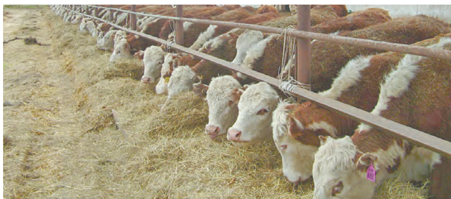
Развиваются сельскохозяйственные предприятия района.

завод, выпускающий греческие йогурты. Сейчас там работают 30 человек, но в скором времени это число увеличится до 45.