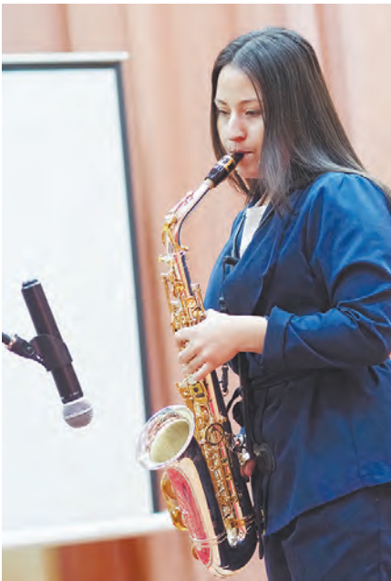
Праздничную атмосферу в зале помогли создать са- модельные артисты из числа студентов-тими- рязевцев.

развития сельского хозяйства. Это главы районных администраций, их заместители и руководители муни- ципальных отделов АПК. Большин- ство награждённых уже хорошо из- вестны в нашем регионе, подобные награды они получают не впервые. А это является очередным подтвержде- нием их преданного служения АПК.