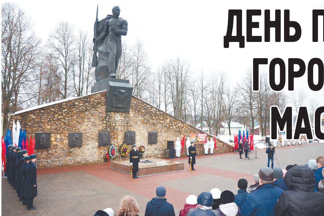
Митинг в день освобождения города.

Сегодня юхновчане отмечают освобождение своей малой родины в 1942 году от ненавистного врага