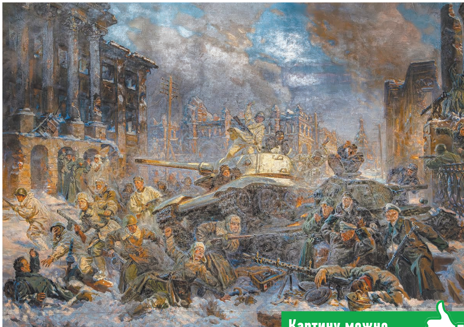
Картина «Освобождение Калуги» написана на холсте размером 2,15 на 3 м.

В эти дни его впервые можно лицезреть в оригинале. Благодаря содействию губернатора Владислава Шапши, в Калугу картину привезли из Иркутска на выставку, которая организована в музее.