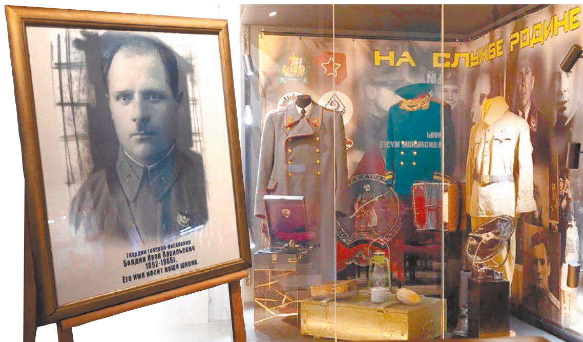
Портрет Болдина, который школе № 4 передали ветераны 50-й армии.