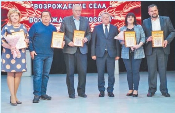
Прошлогодние победители конкурса «Возрождение села – возрождение России».

Министерство сельского хозяйства области объявляет о старте очередного регионального конкурса «Возрождение села – возрождение России». Это один из старейших конкурсов министерства сельского хозяйства области, который проводится с 2004 года. Как и в прежние годы, в этом конкурсе принимают участие отдельные журналисты и коллективы авторов, а также издания, редакции газет, журналов, теле- и радиокomпании, регулярно освещающие вопросы развития агропромышленного комплекса области и сельских территорий. На конкурс представляются материалы любых жанров, отражающие следующие темы: сельскохозяйственное производство и малое предпринимательство на селе; развитие кооперации на селе; инвестиционная деятельность в агропромышленном комплексе Калужской области; социальное развитие села; сохранение культурно-исторического и природного потенциала сельских территорий, агротуризм; сохранение трудовых, нравственных, духовных и народных традиций сельских жителей. Печатные матери-