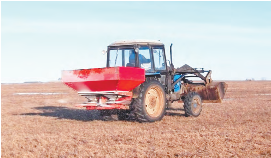
Подкормка многолетних трав.

Сейчас в хозяйствах региона завершается закупка семян, в том числе и элитных, под весенний сев. Подготовка машинно-тракторного парка также завершена. Сельхозпредприятия продолжают активно закупать удобрения и горюче-смазочные материалы к