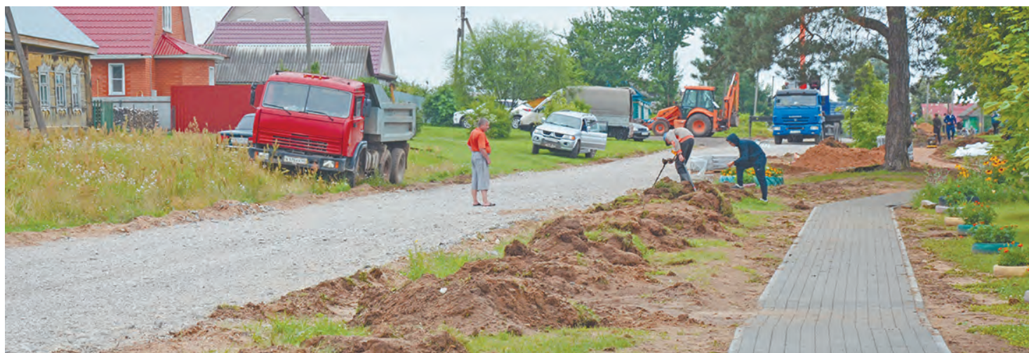
Ремонт дороги в деревне Барановка.