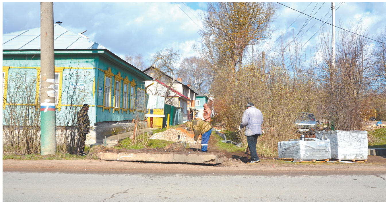
Улица Калужская. Благоустройство началось еще весной.