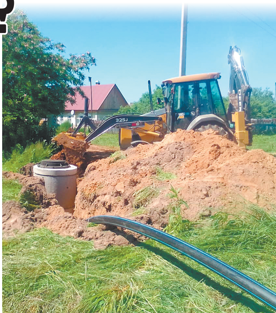
Идет монтаж колодцев.