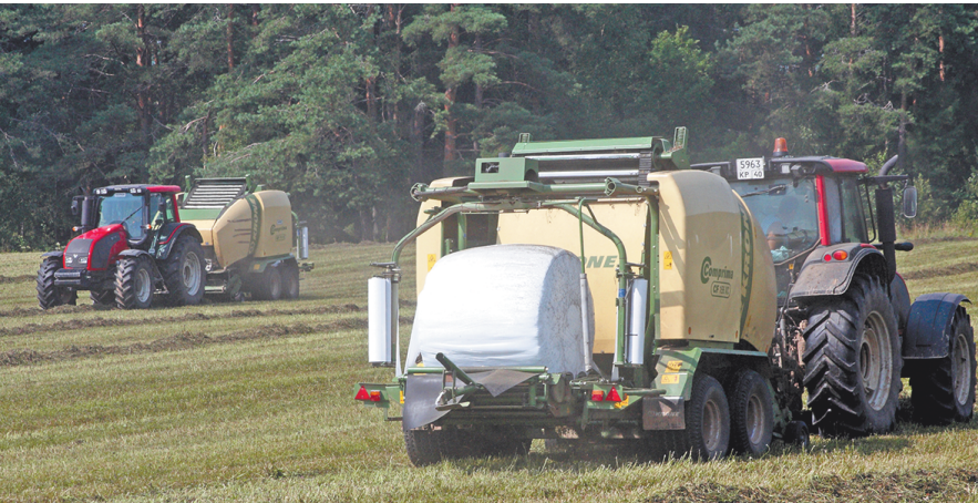
Заготовка кормов в Мосальском районе.