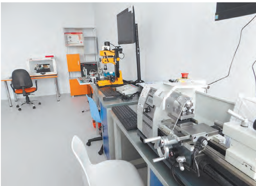
В кабинете трудового обучения.

3D-принтеров в tandem с ноутбуками, небольшие станки с числовым программным управлением, комплекты для конструирования