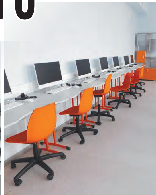
Один из кабинетов информатики.

Начнем с того, что входить в здание ребятам будет по ученическим картам, включенным в общую систему программного обеспечения «Умная школа». Даже расписание уроков – не на бумаге, а на сенсорных экранах, размещенных в коридорах школьного здания, где каждый этаж оформлен в своей цветовой гамме. На стенах вместо привычных стендов и плакатов – ху-