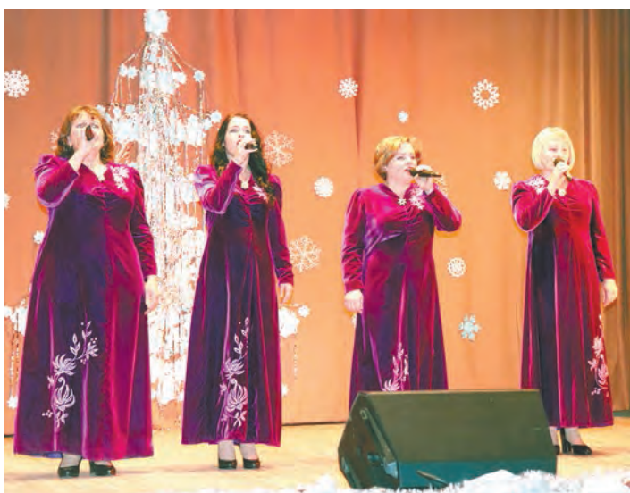
Выступает ансамбль «Ивушка».

По информации пресс-службы правительства области.